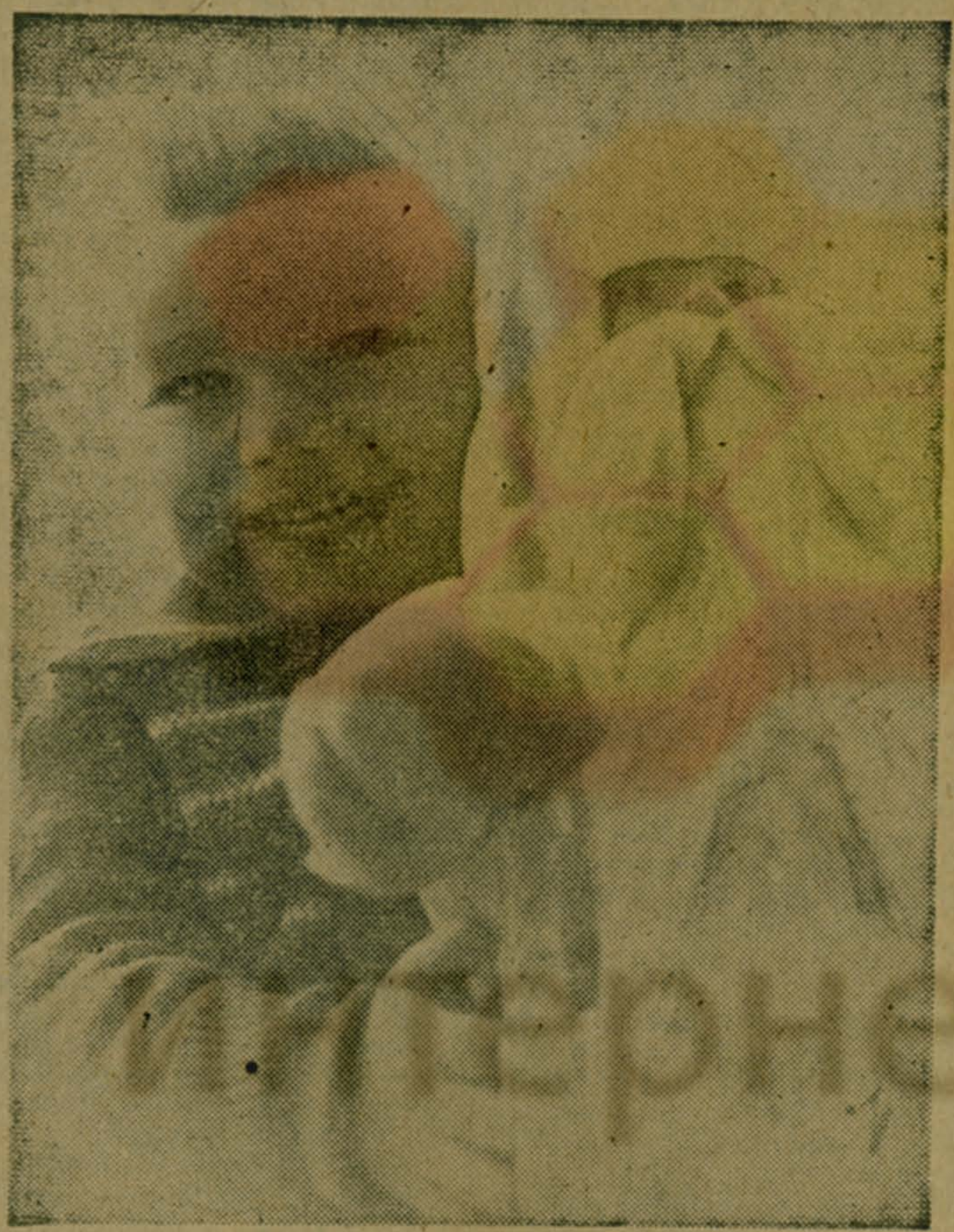
«ВОТ КТО МНЕ ПОДАРОК ПРИНЕС!»