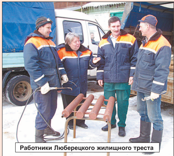
Работники Люберецкого жилищного треста