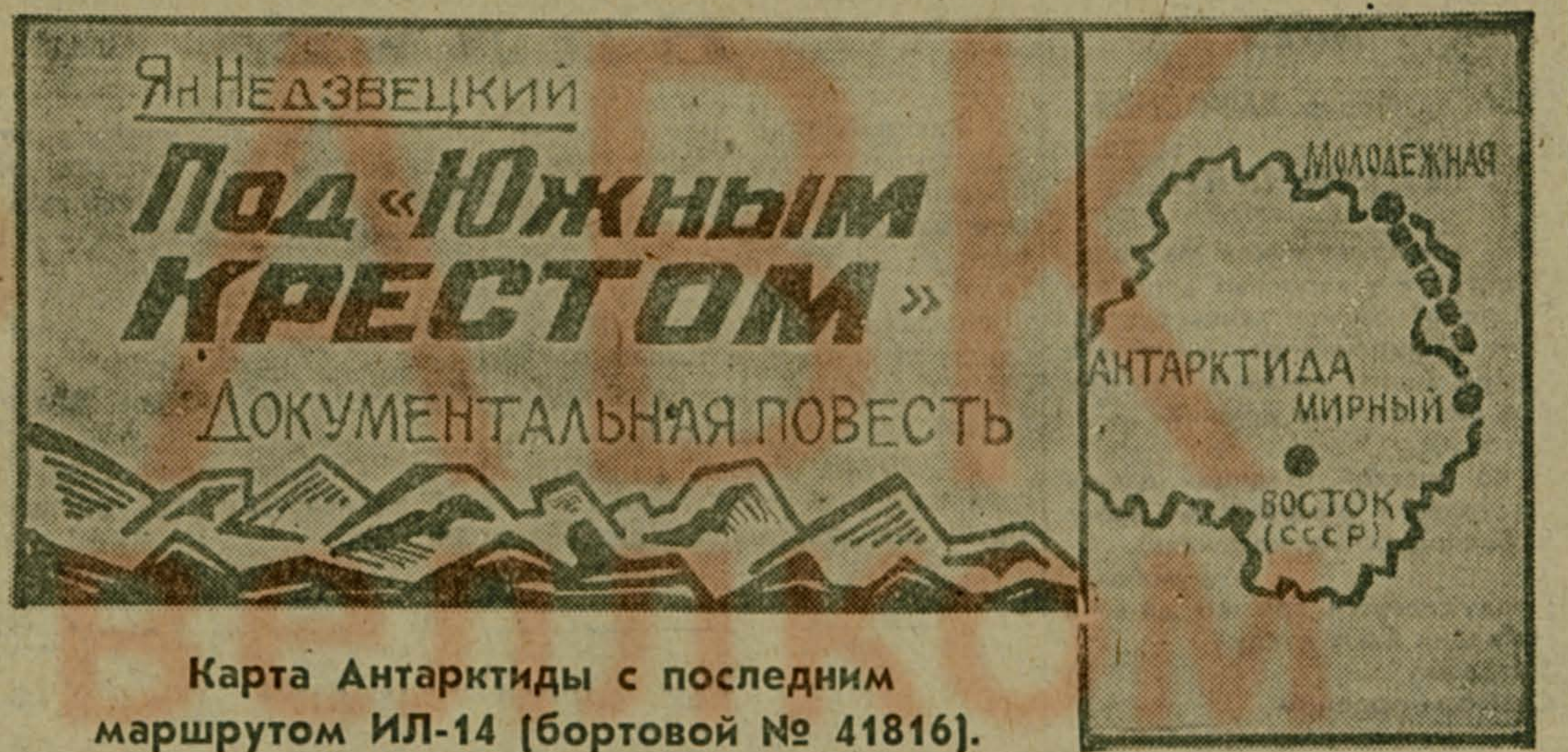
Карта Антарктиды с последним маршрутом ИЛ-14 (бортовой № 41816).