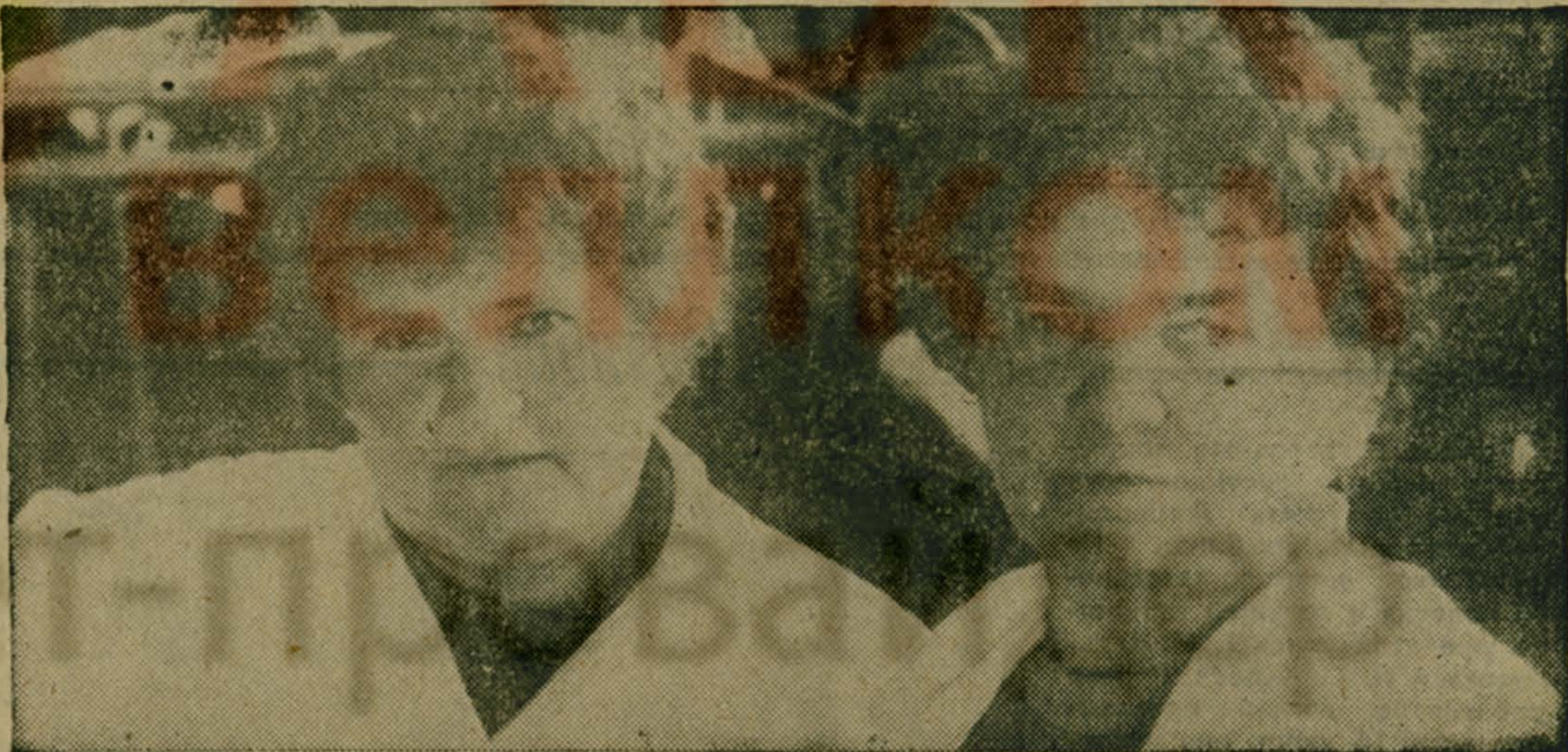
Колхоз имени Ленина — единственное в районе хозяйство, где телятницы входят в подрядную животноводческую бригаду. В этом немалый смысл. Сегодняшние телята через три года станут коровами. Их продуктивность во многом за-