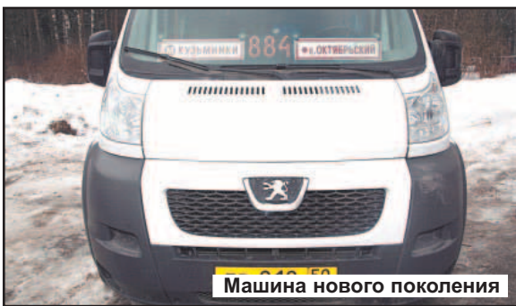
Машина нового поколения