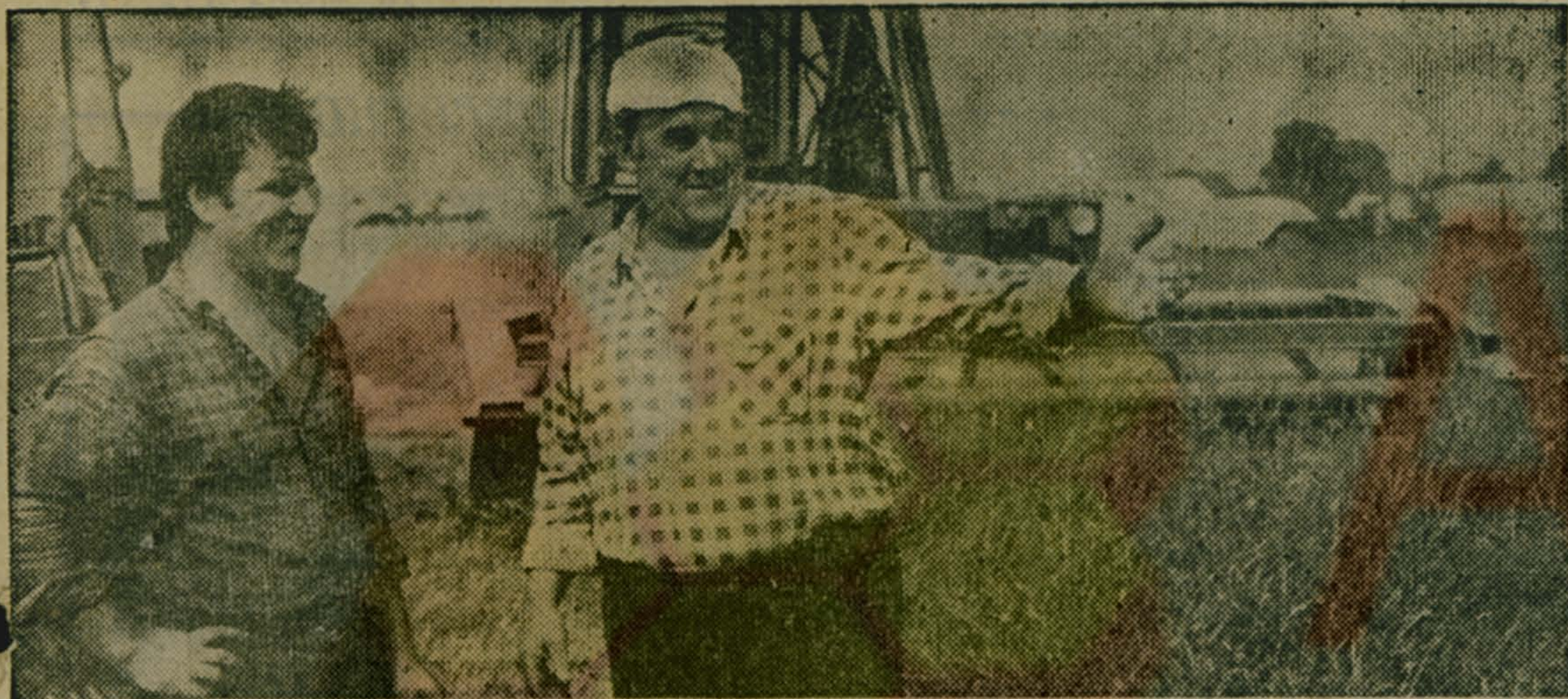
Пролетарии всех стран, соединяйтесь!