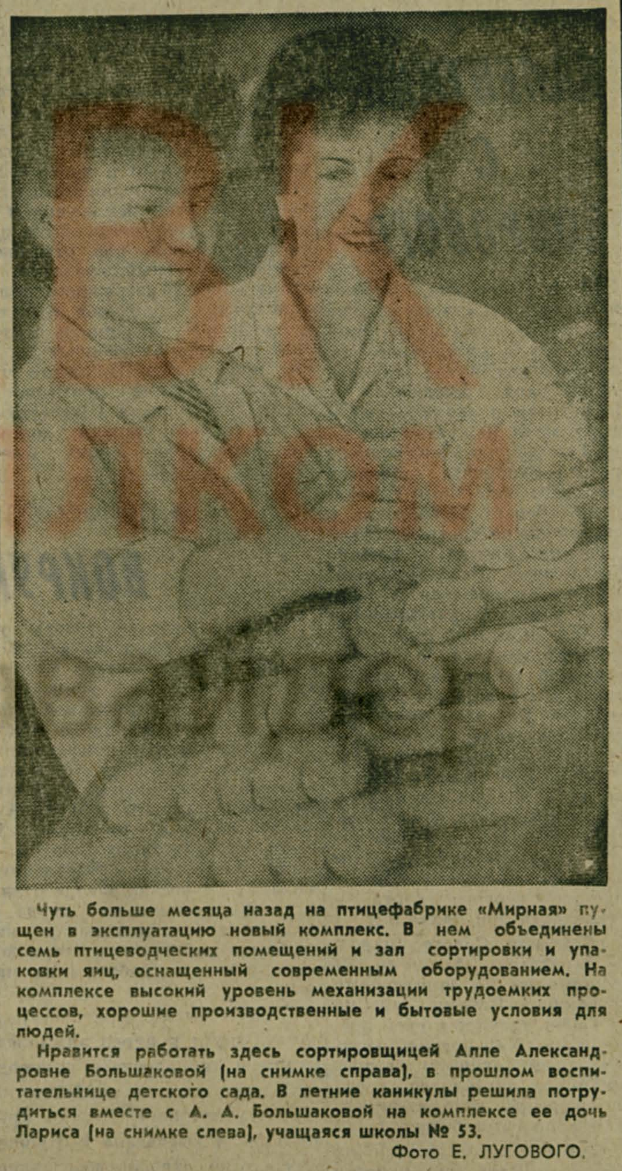
Чуть больше месяца назад на птицефабрике «Мирная» пущен в эксплуатацию новый комплекс. В нем объединены семь птицеводческих помещений и зал сортировки и упаковки яиц, оснащенный современным оборудованием. На комплексе высокий уровень механизации трудоемких процессов, хорошие производственные и бытовые условия для людей.