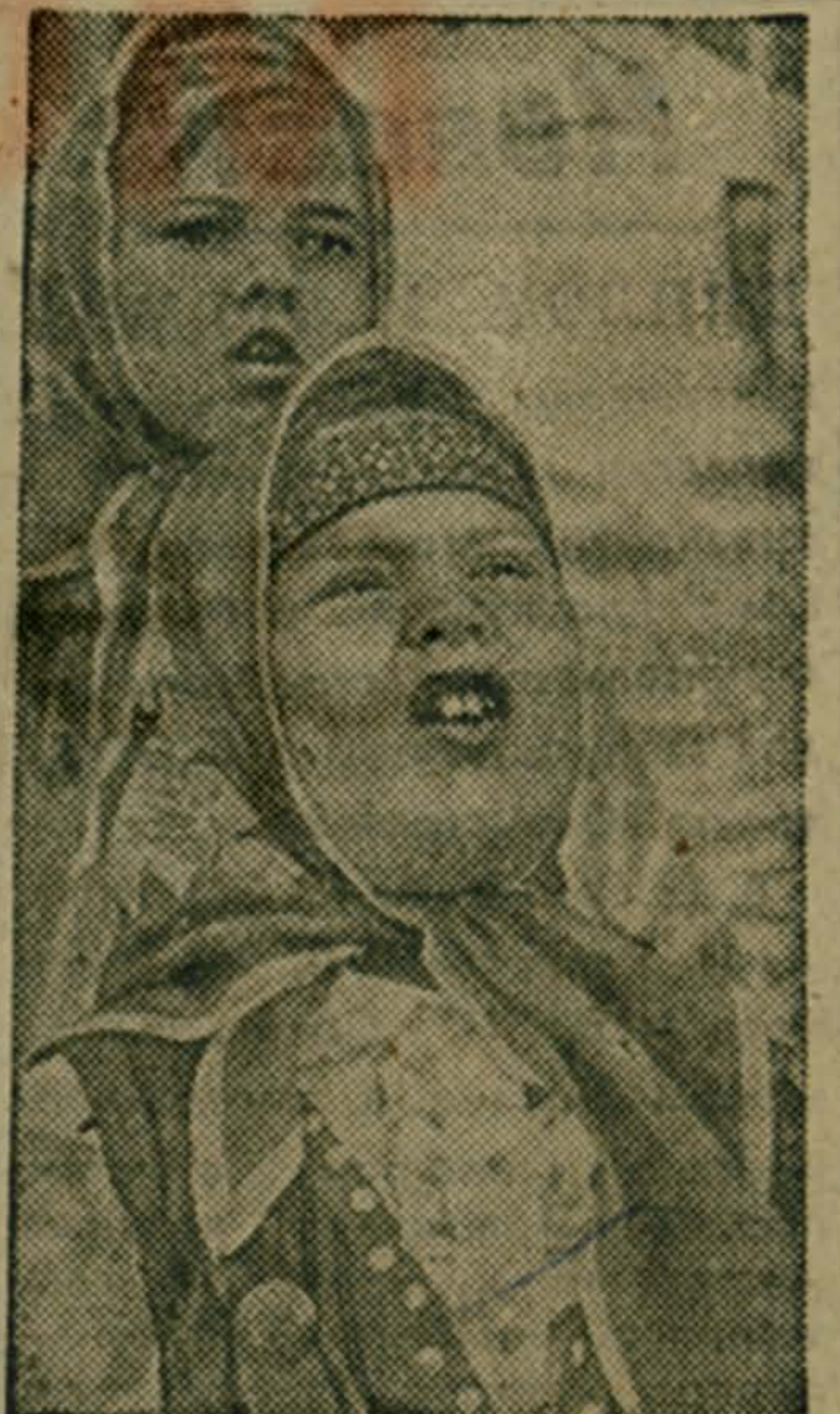
В столице Эстонии прошел VI праздник песни и танца школьников, посвященный 70-летию Великого Октября и 65-летию пионерской организации имени В. И. Ленина. Познакомиться с искусством эстонских ребят и показать свое мастерство приехали их сверстники из многих союзных республик, а также городов-побратимов Таллина — Сольнока [ВНР] и Шверина [ГДР]. На снимке: участницы хора младших школьников.

А. КРИВОШПЫКОВ, редактор стенгазеты завода.