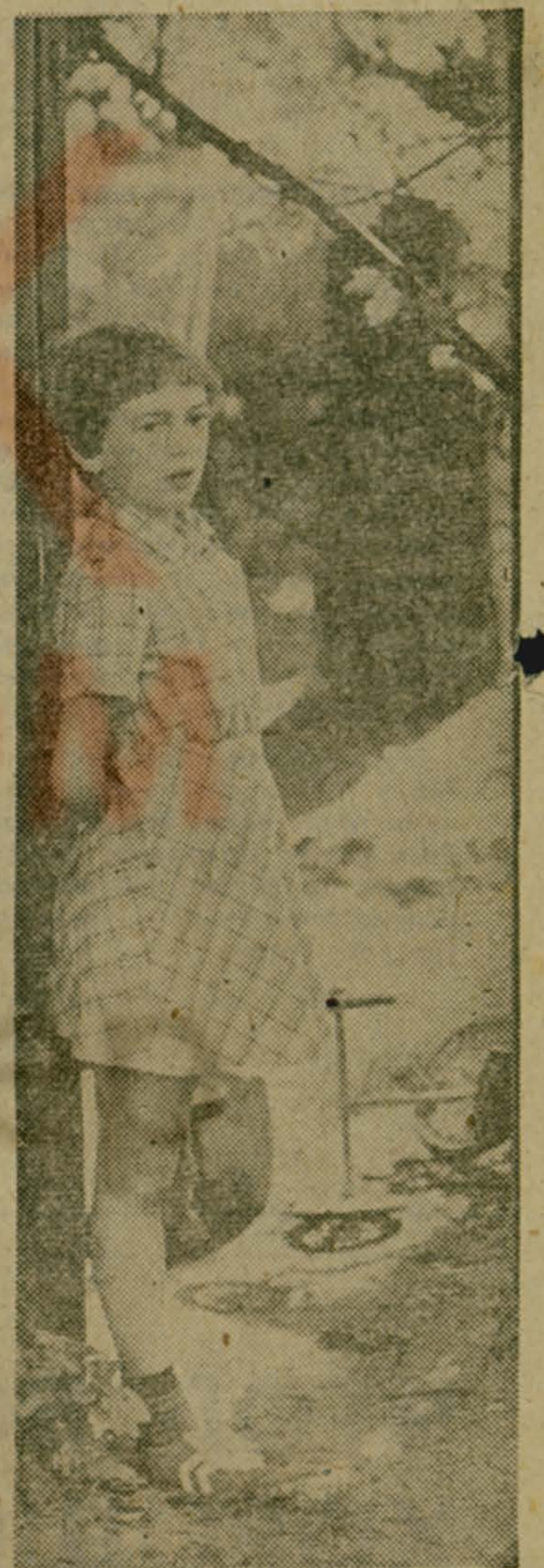
Девочка из нашего двора.

(Продолжение. Начало в №№ 134, 137, 141, 145, 147, 149).