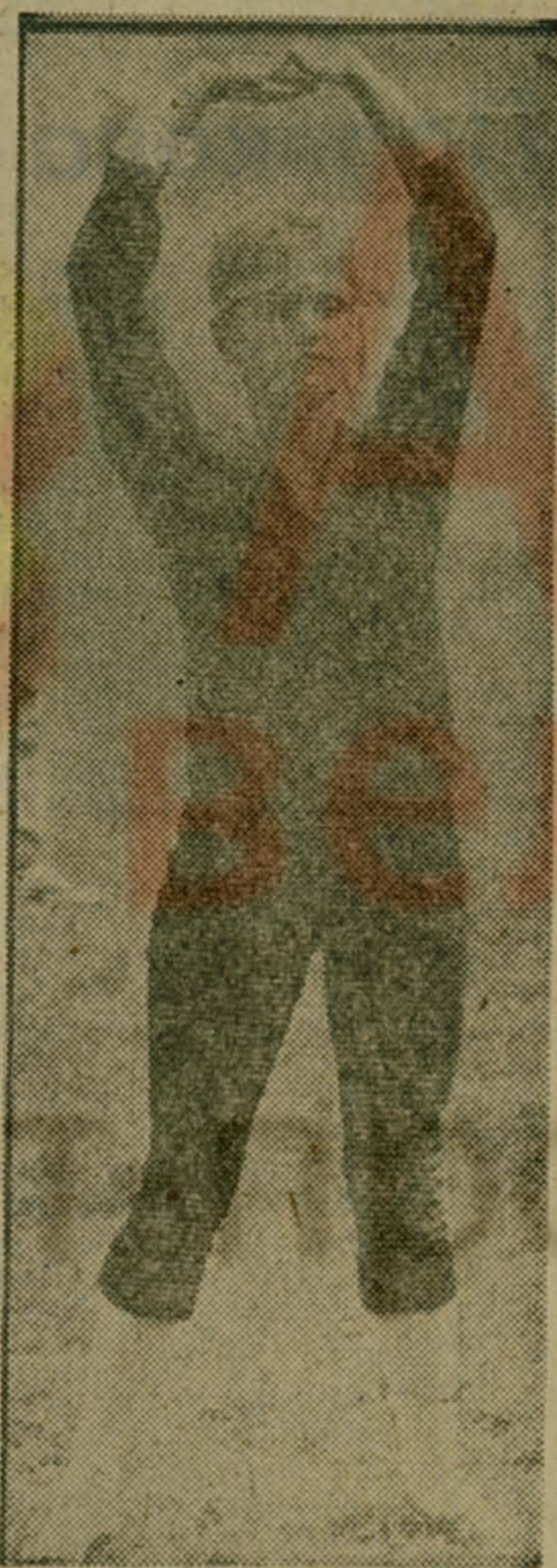
Займемся аэробикой...