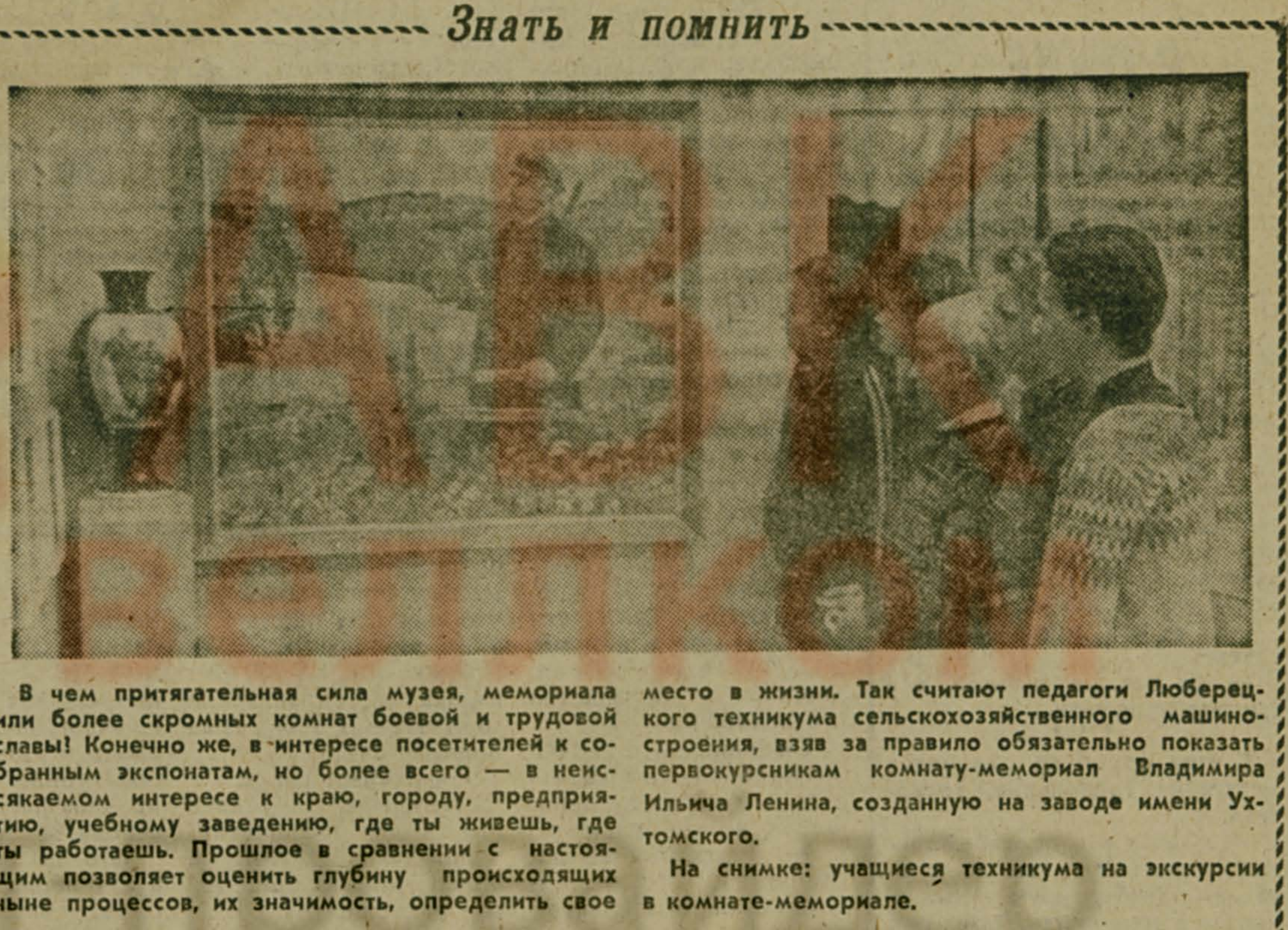
В чем притягательная сила музея, мемориала или более скромных комнат боевой и трудовой славы! Конечно же, в интересе посетителя к соборным экспонатам, но более всего — в неиссякаемом интересе к краю, городу, предприятию, учебному заведению, где ты живешь, где ты работаешь. Прошлое в сравнении с настоящим позволяет оценить глубину происходящих ныне процессов, их значимость, определить свое

место в жизни. Так считают педагоги Люберецкого техникума сельскохозяйственного машиностроения, взяв за правило обязательно показывать первокурсникам комнату-мемориал Владимира Ильича Ленина, созданную на заводе имени Ухтомского.