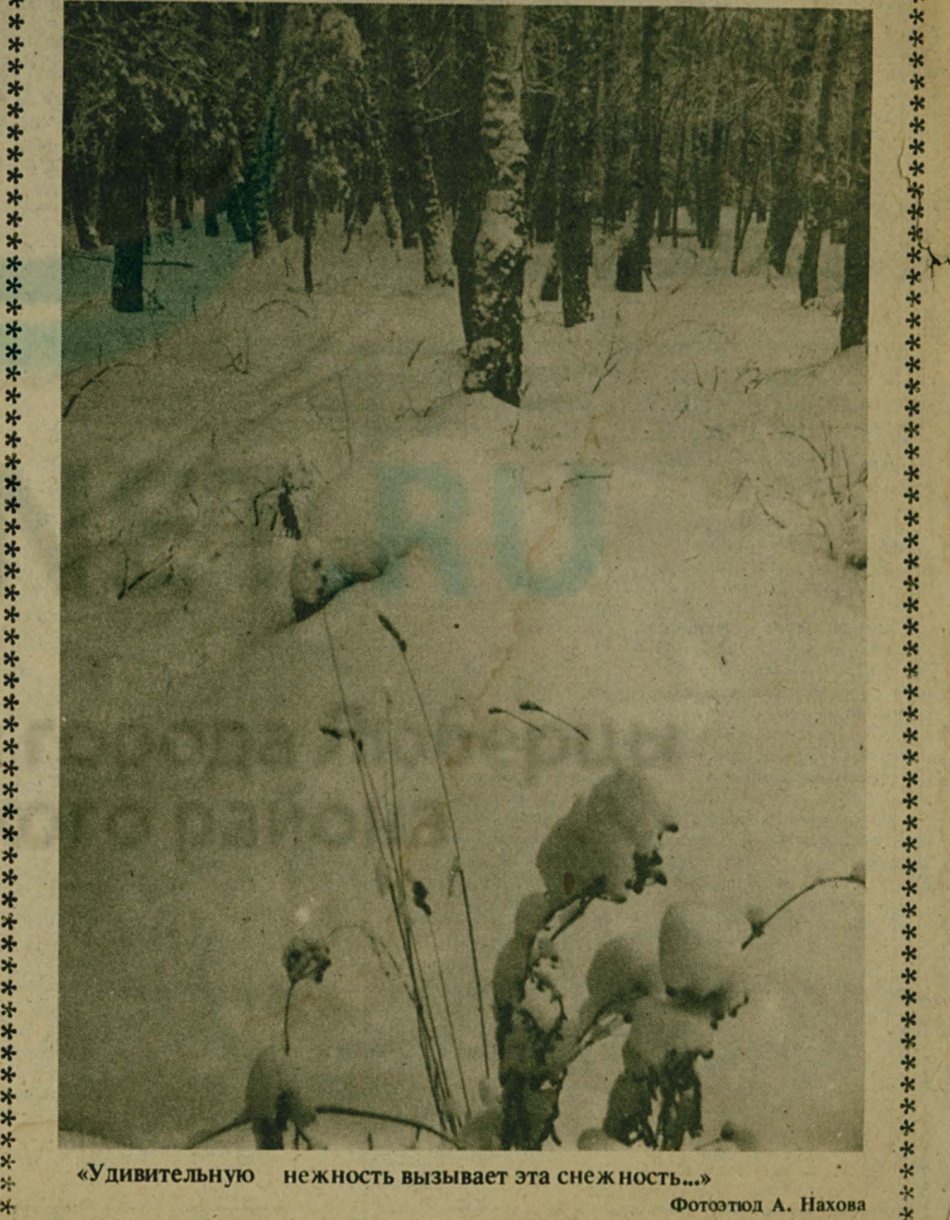
«Удивительную нежность вызывает эта снежность...»

кубок «Дружба» Л.Н. Миронова. За пять дней пребывания на фермах Мироновского района люберчане оказали украинским животноводам существенную практическую помощь в освоении интенсивной технологии производства молока, за что получили искреннюю благодарность. Р.СТЕПНОВА.