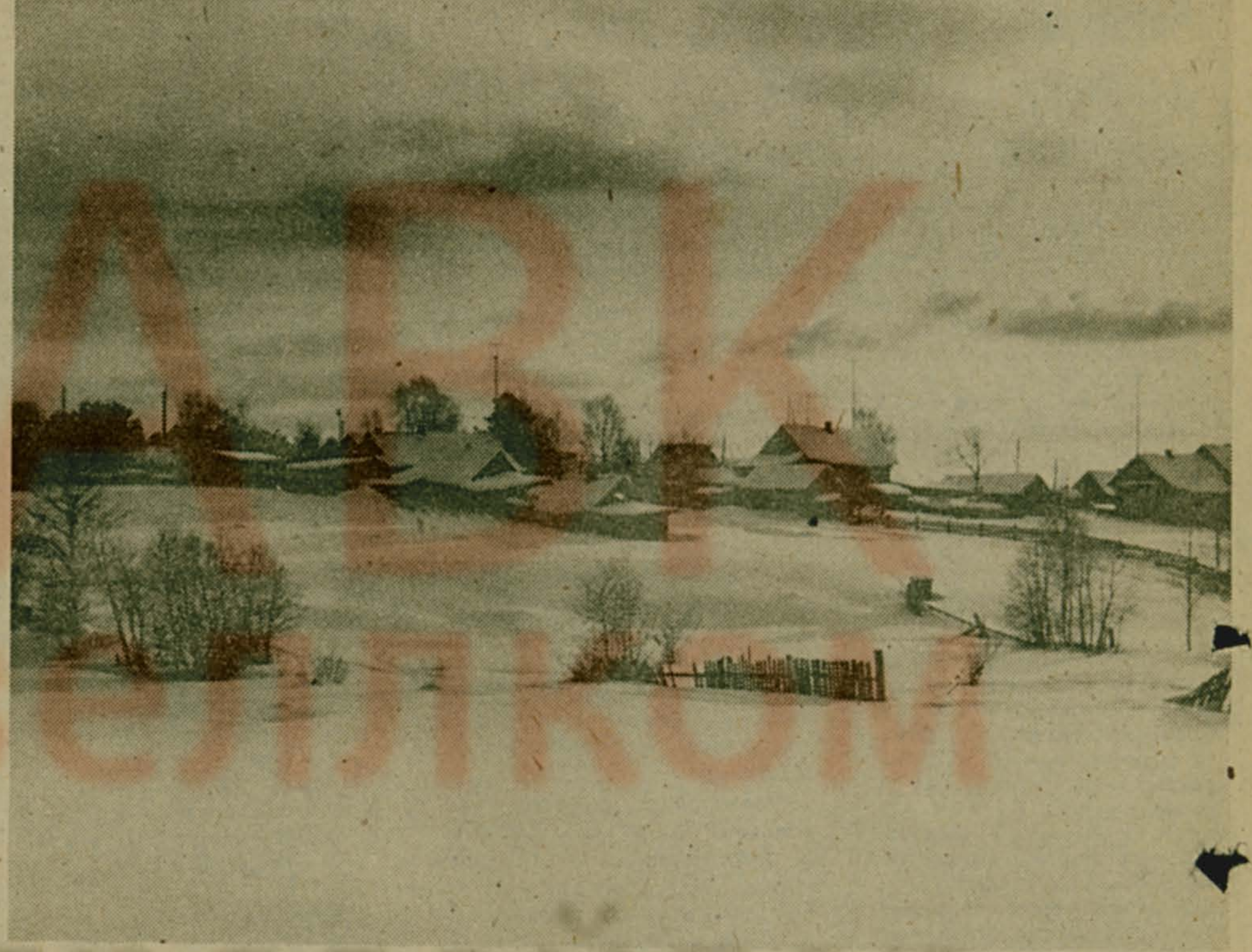
«Вот моя деревня...»