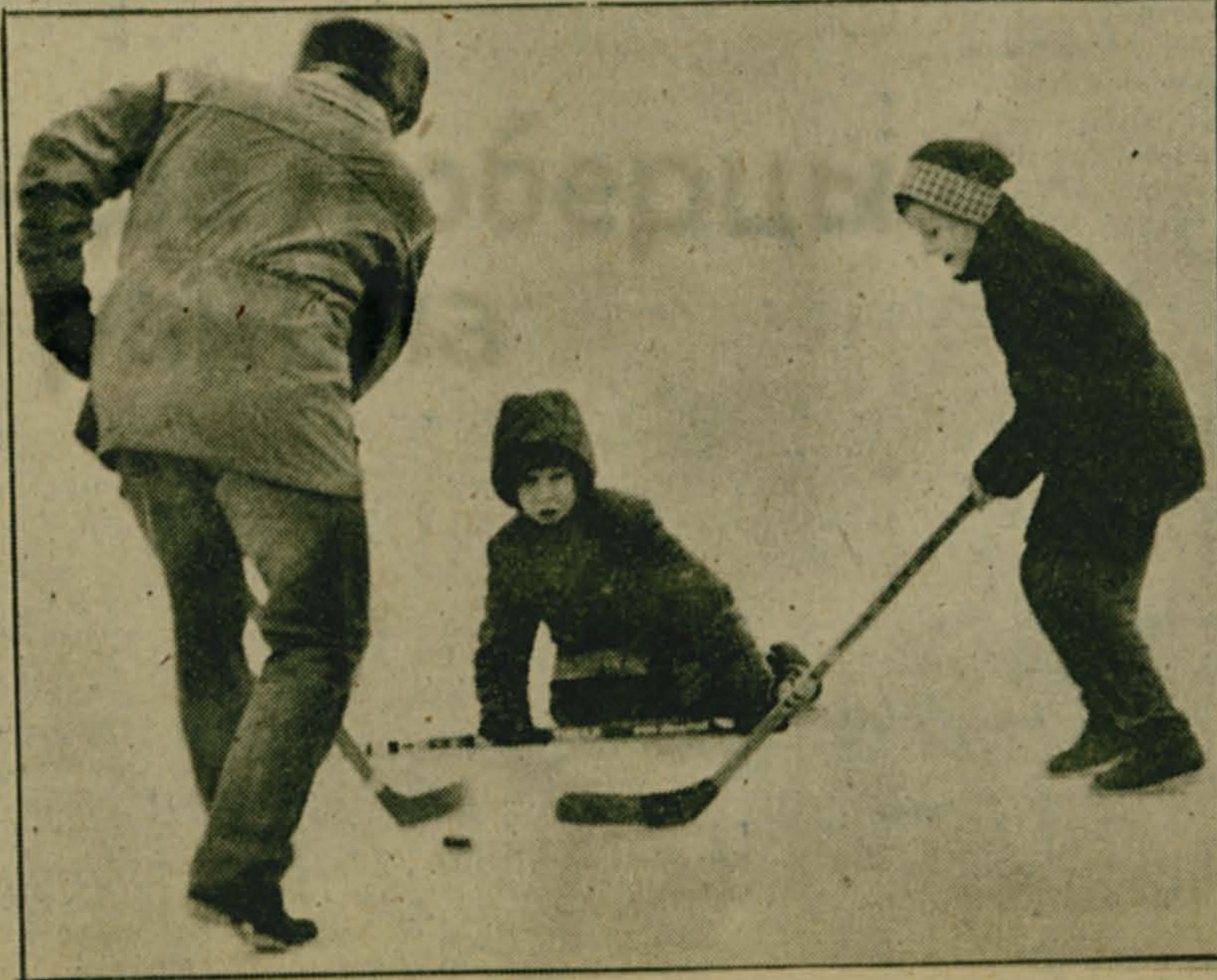
«ПОКАЖИ КЛАСС, ПАПА!»

П. ПАНИНА, организатор внеклассной работы.