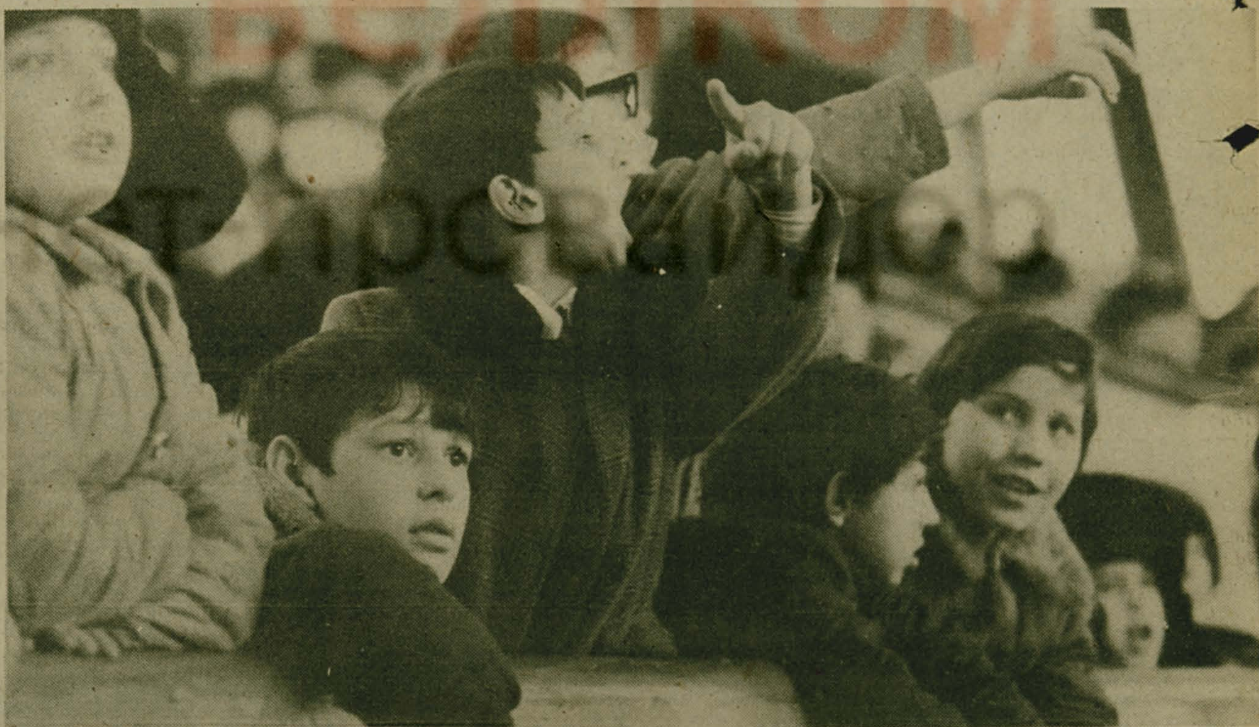
Страсти на трибунах.