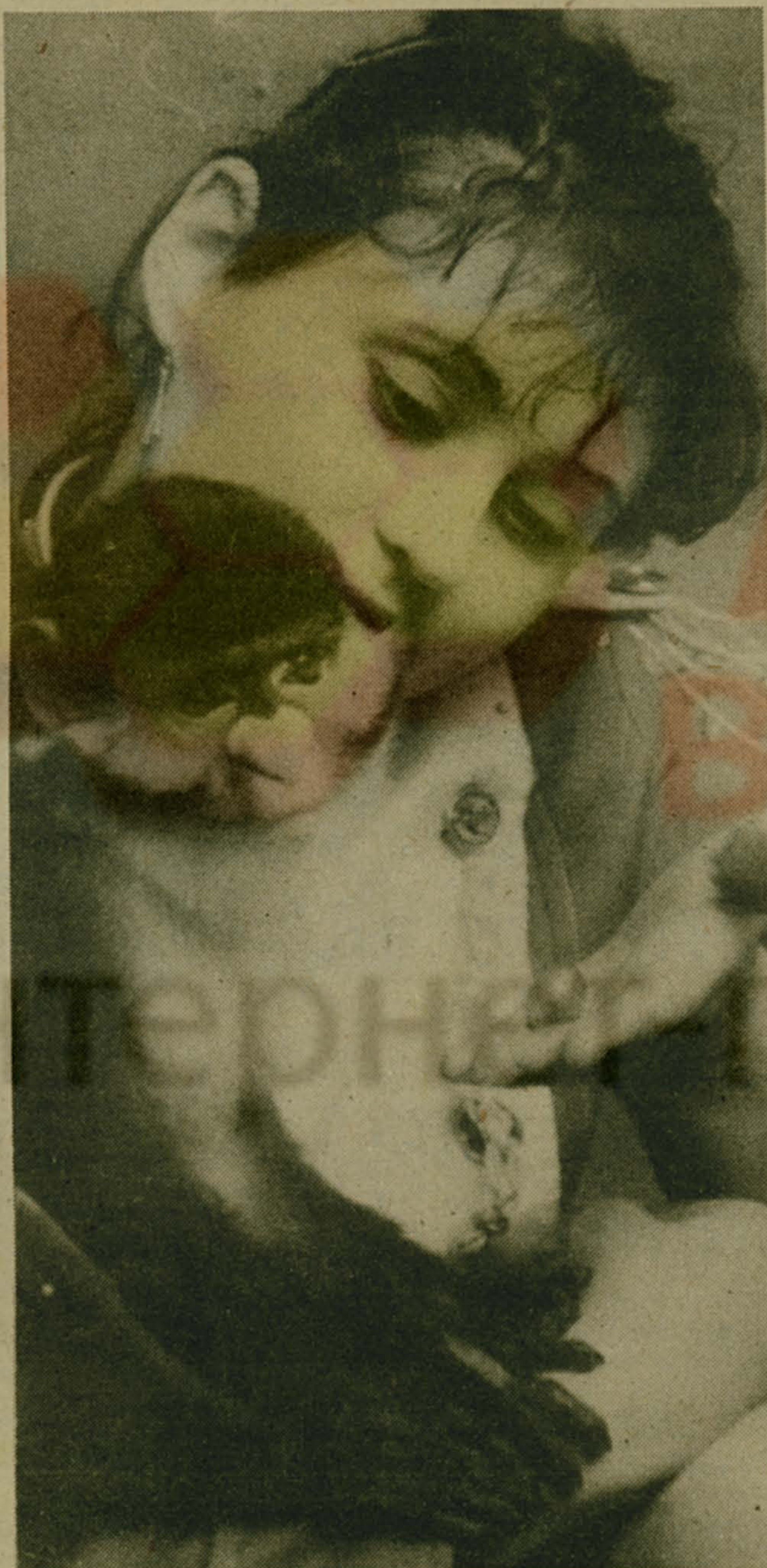
В шумной семье учащихся СПТУ № 10 прижилась эта маленькая обезьянка.