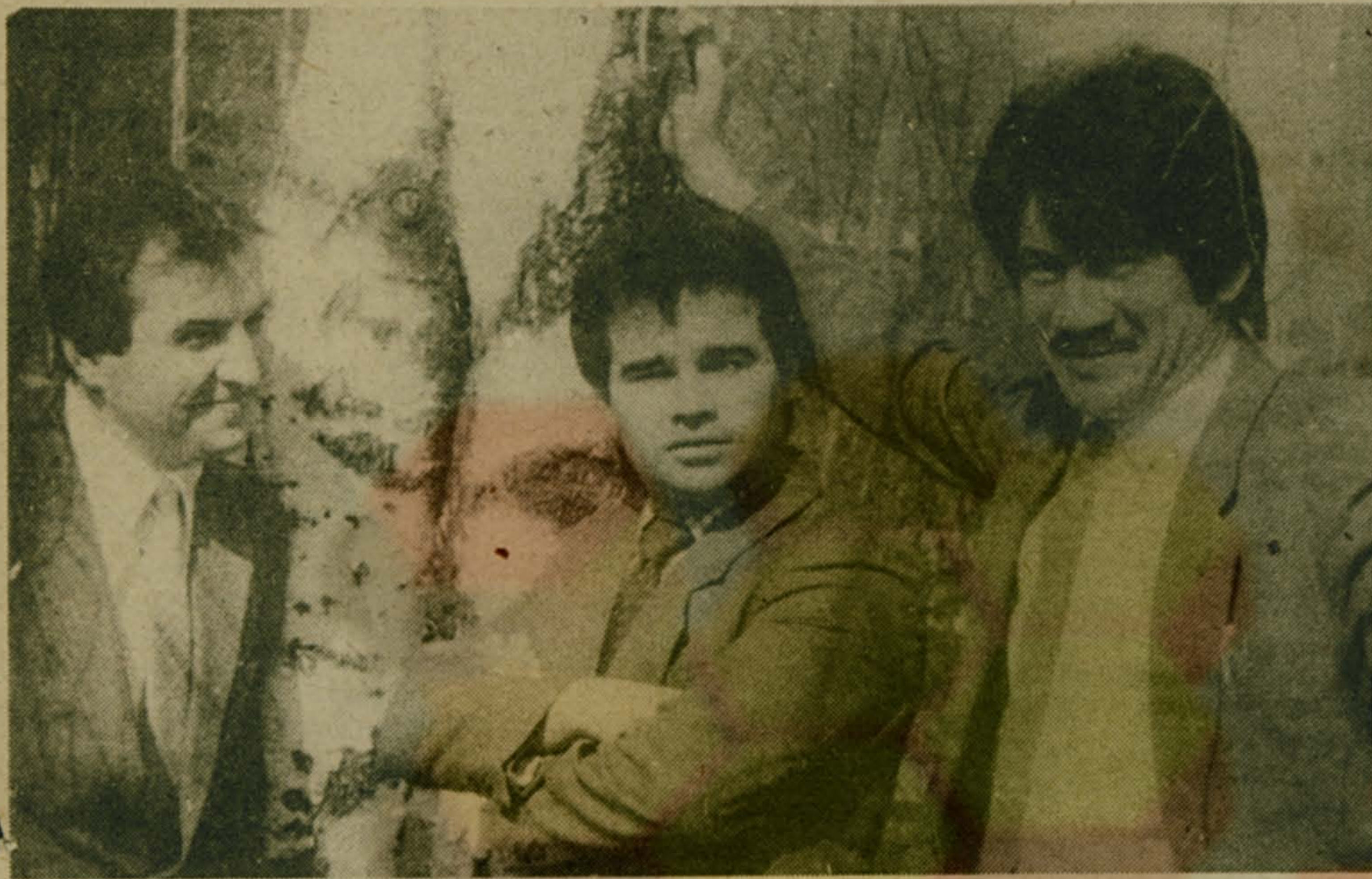
Снимки эти сделаны СПТУ-50 города Дзержинского. Это учебное заведение известно в нашем районе как кузница кадров для промышленных предприятий. Мальчишек и девочек привлекает сюда возможность разнообразного выбора профессий, хорошая учебная и спортивная база. Но все же настоящую славу училищу приносят его педагоги.