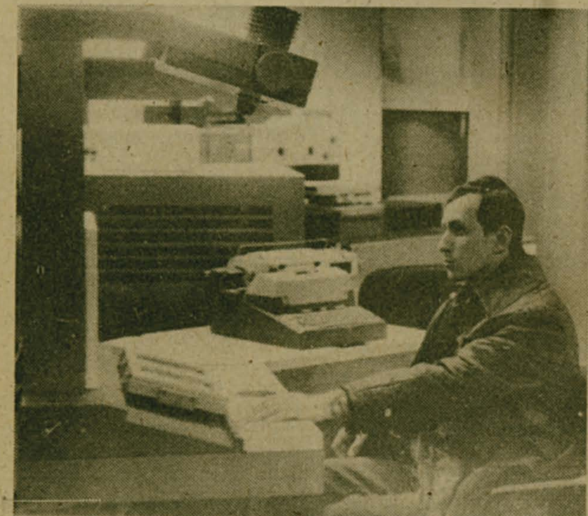
◆ НА СТЕНДАХ ВДНХ Топливо — природный газ

Установка программированной сборки, которая показана на верхнем снимке, предназначена для эксплуатации в цехах сборочно-монтажных производств. Она обеспечивает хранение сменного-суточного комплекта изделий электронной техники в магазине-накопителе, а также синхронную подачу в рабочую зону оператора требуемого номинала с одновременной индикацией сфокусированным световым символом места его установки на печатной плате и выдачей информации об всех ее особенностях.