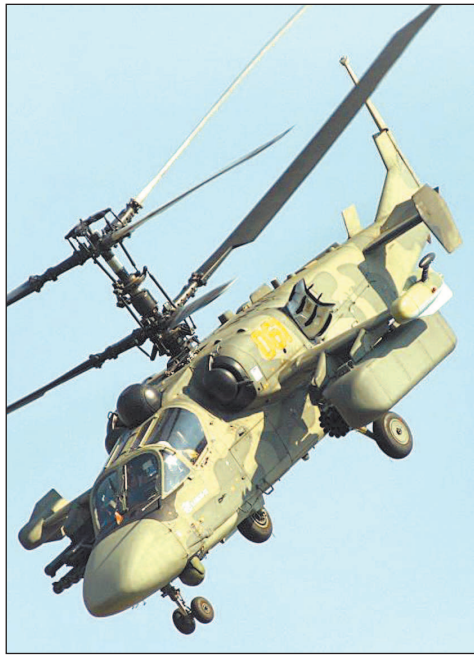
«Аллигатор» и редкого гостя российских выставок Enstrom 280.

В павильоне для демонстрации будут выставлены 15 вертолетов, произведенных: MB3 им. М.Л. Миля, «Камов», «KB3», Eurocopter, Agusta Westland, Robinson, MD, Enstrom. Особенностью экспозиции этого года станет демонстрация натурального образца вертолета Ка-52