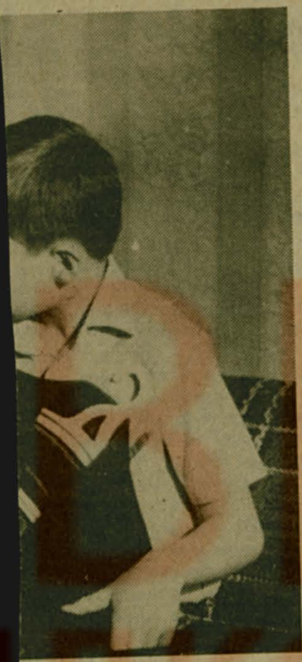
...лилось восемьдесят лет. За... сложная, но очень инте...

Ярмарка в люберецкой средней школе № 6 удалась. Народ повеселился и денег выручили более 450 рублей. Их перечислили в Советский Фонд мира. Д. БОКОВ, юнкор.