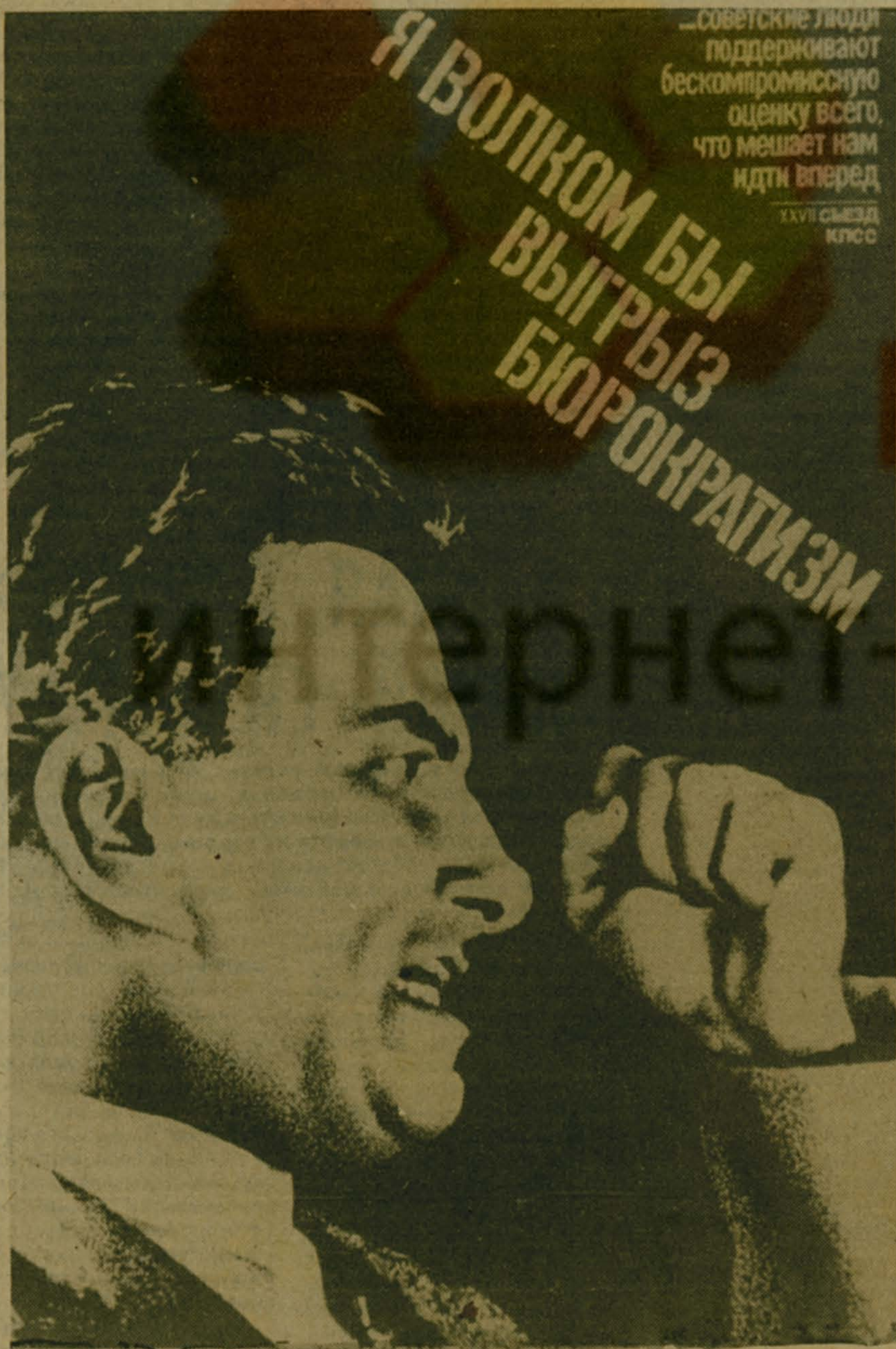
Плакат художника И. БОБЕНЧИКА.