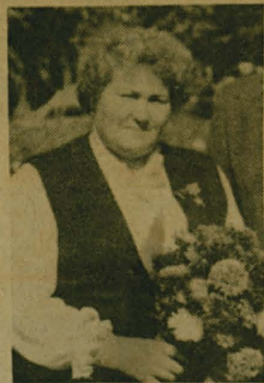
ИНТЕРВЬЮ С ДЕЛЕГАТОМ

— Многое изменилось в лучшую сторону в нашем обществе со времени XXVII съезда КПСС, — говорит моя собеседница. — Взять хотя бы наш район. Сузилась поток мероприятий, на которые то и дело вызывали в горком КПСС, исполком горсовета хозяйственных руководителей, специалистов. Теперь они на местах, с нами решают производственные проблемы.