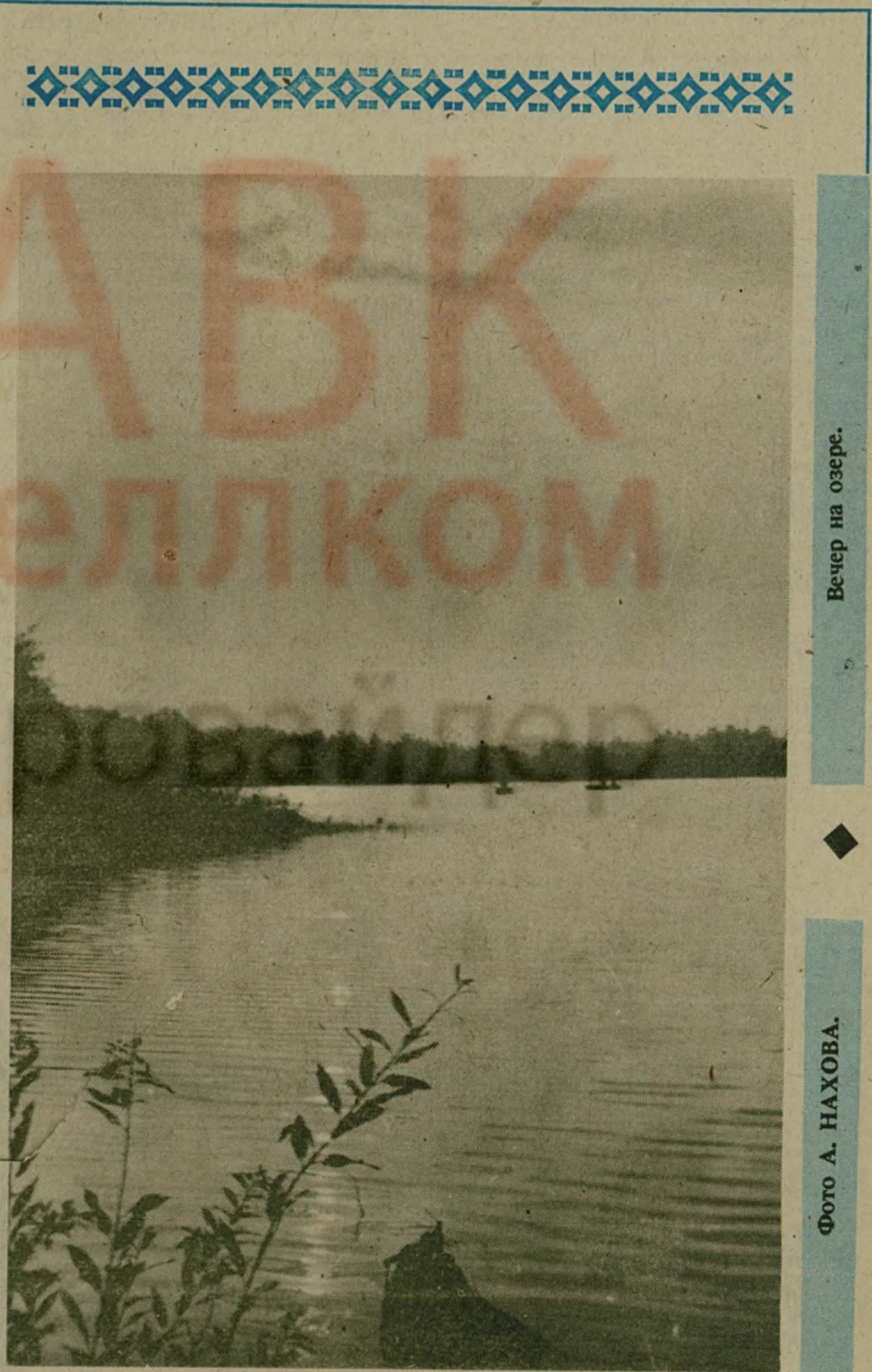
Вечер на озере.