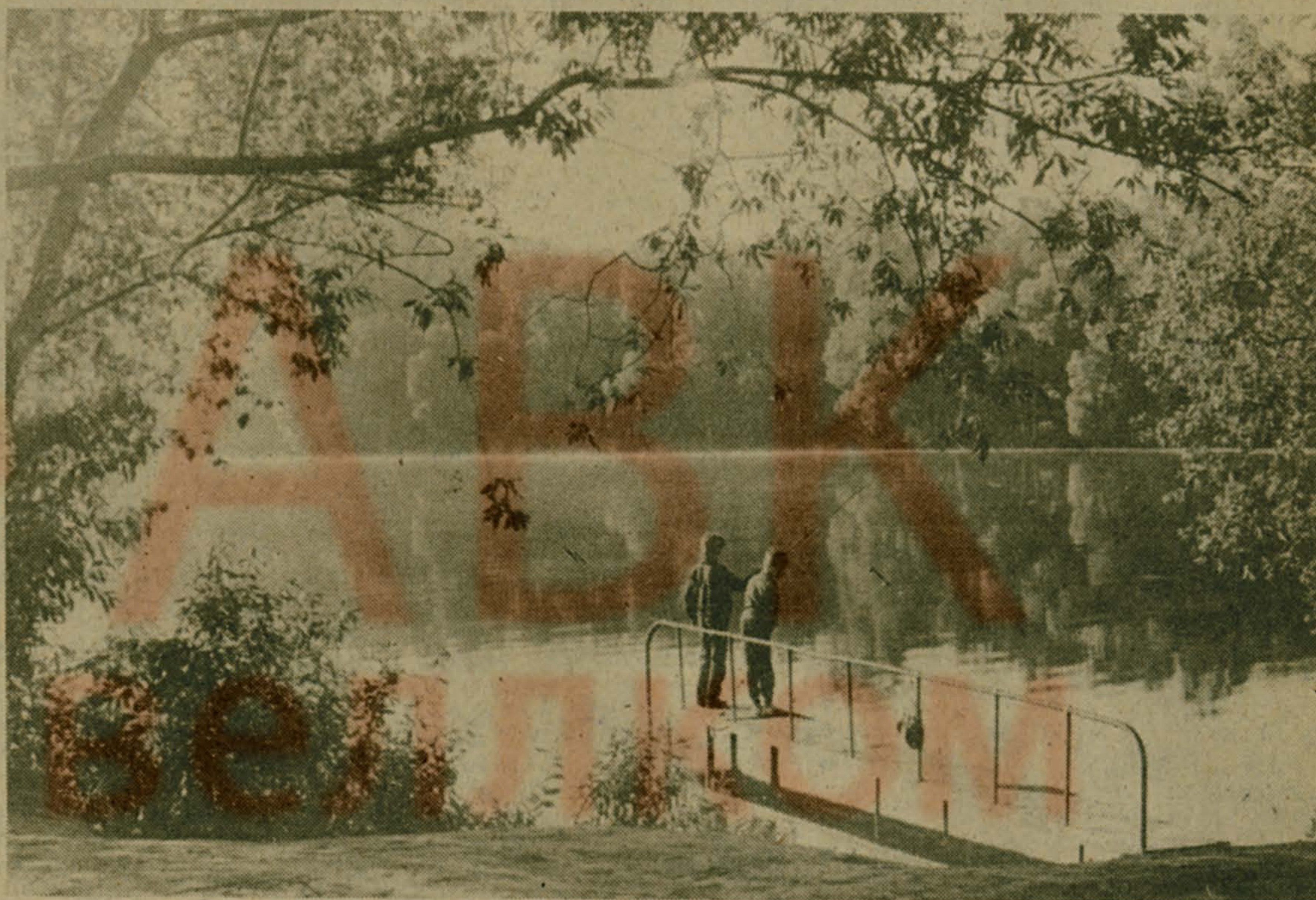
Утро на озере.