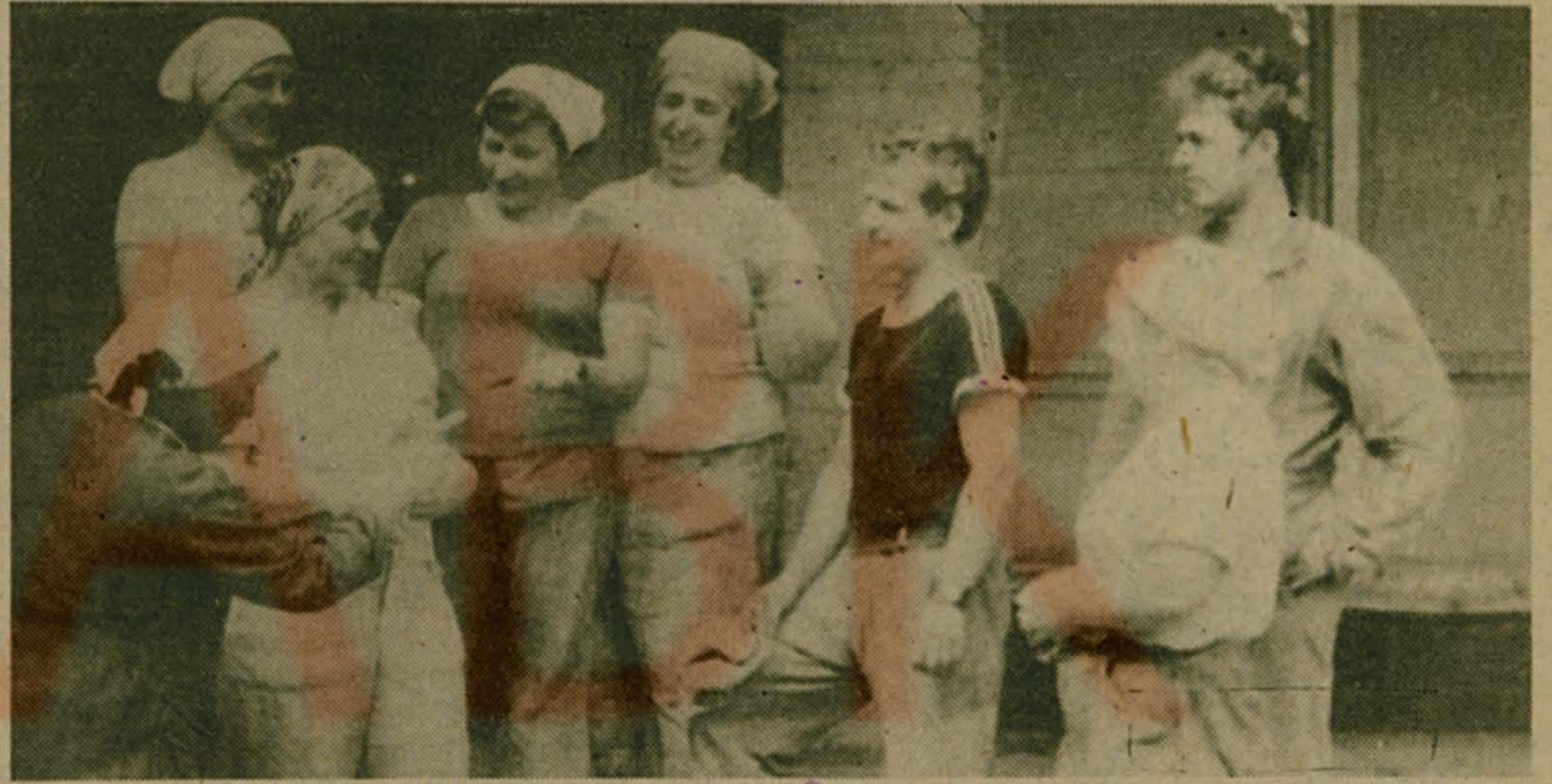
Ударно потрудились на ремонте подшефной школы № 31 рабочие стройцеха совхоза «Белая Дача». Особенно старались маляры. На снимке: бригада маляров совхоза «Белая Дача».