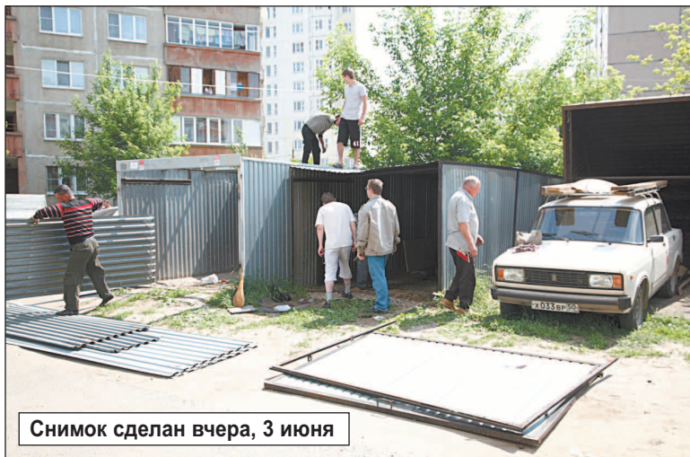
Снимок сделан вчера, 3 июня

Со временем администрация обещает платные стоянки. Одна такая стоянка строится между детской поликлиникой и памятником. Были развешены объявления с телефонами, мы узнали, что место на автостоянке можно приобрести за 53 тысячи рублей. Потом цены поднялись до ста с лишним тысяч! Нам они