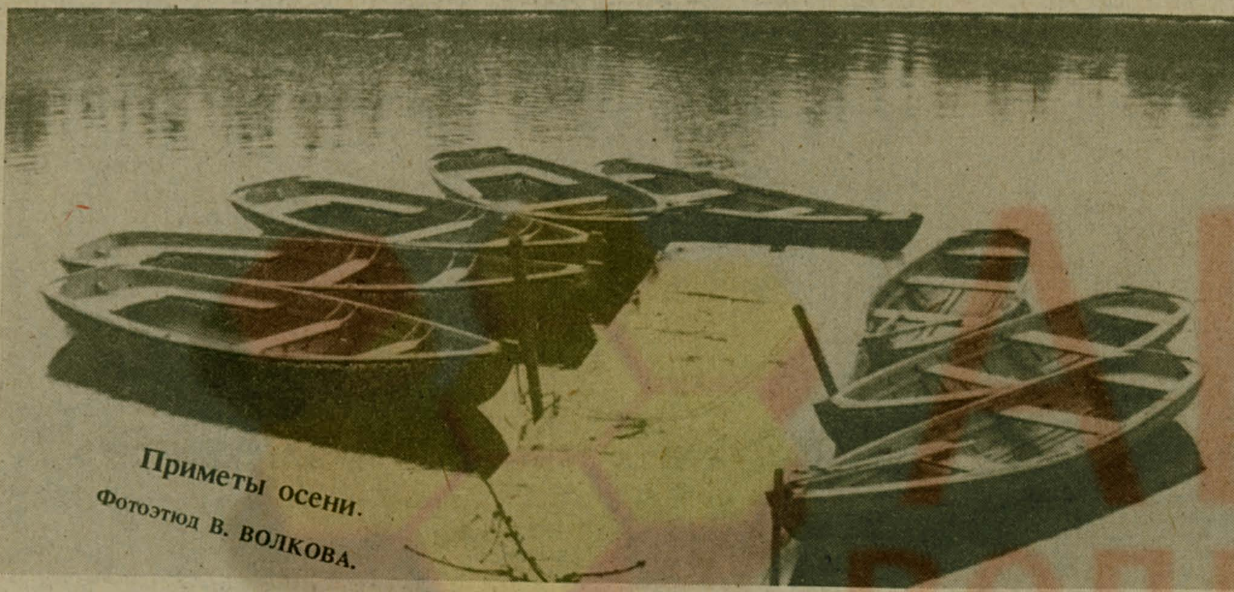
Приметы осени.

...МЫ ЗАКАЖЕМ свадебный букет и выберем свидетелей. С важным видом составим список приглашенных. Будем есть и пить, танцевать и петь песни. Отправимся в свадебное путешествие, а потом вернемся в свое гнездышко. Определенные вполне подходящие, если иметь в виду размеры нашего жилища.