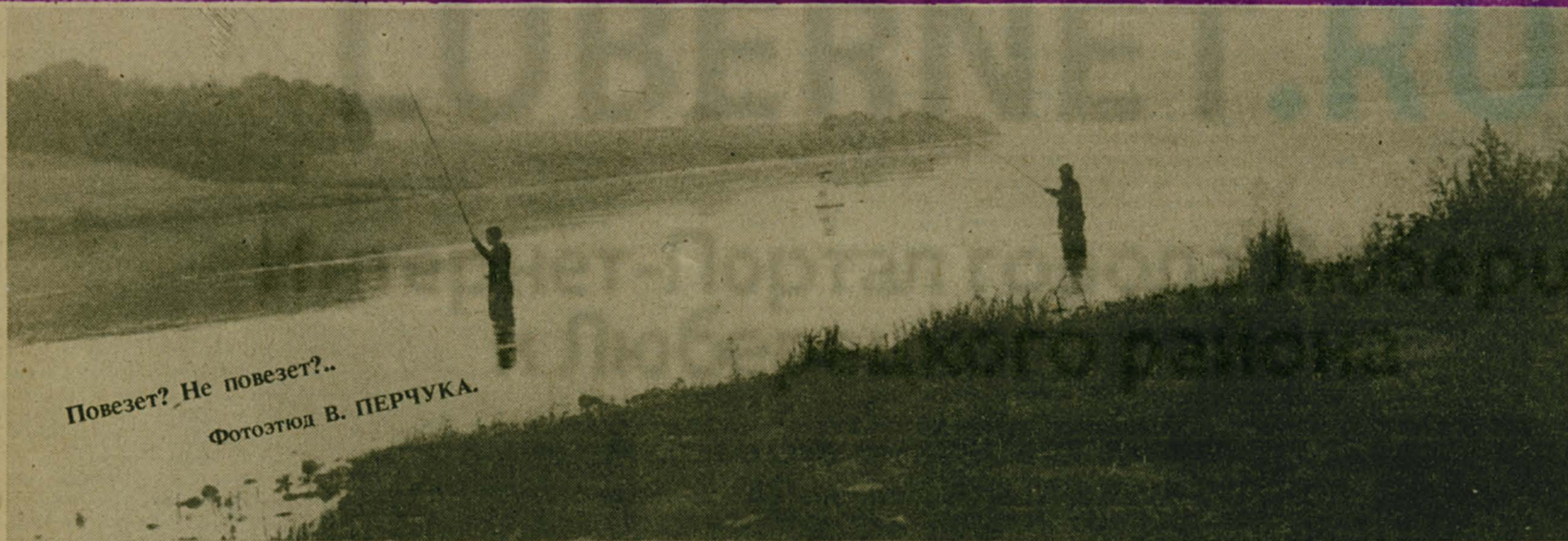
Повезет? Не повезет?..

Сегодня: «НОЧНОЙ ЭКИПАЖ» — 13, 17; вечер отдыха «Давайте познакомимся» — 19. Завтра: «ЗНАХАРЬ» — 16-30.