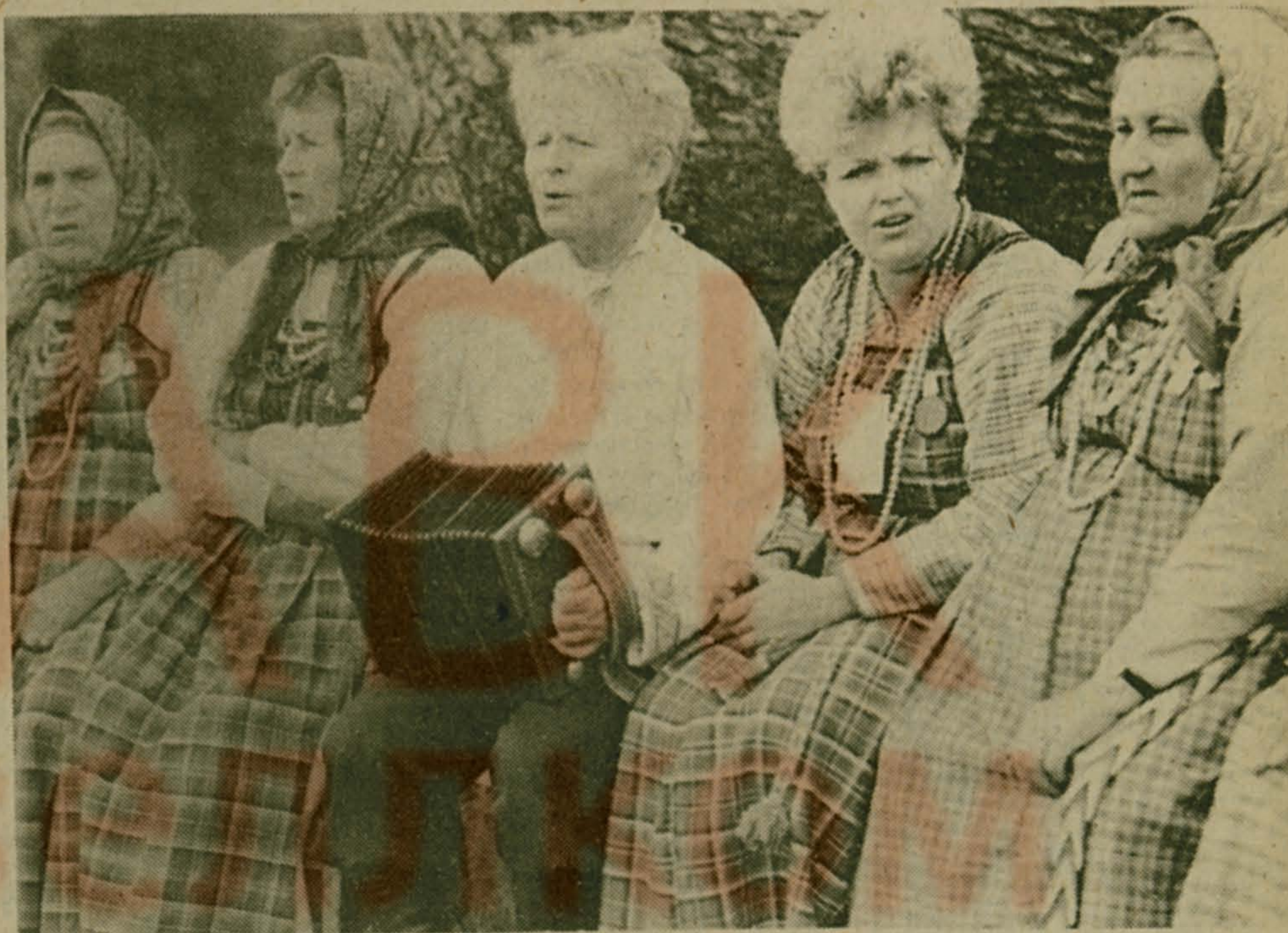
Первый парень на деревне