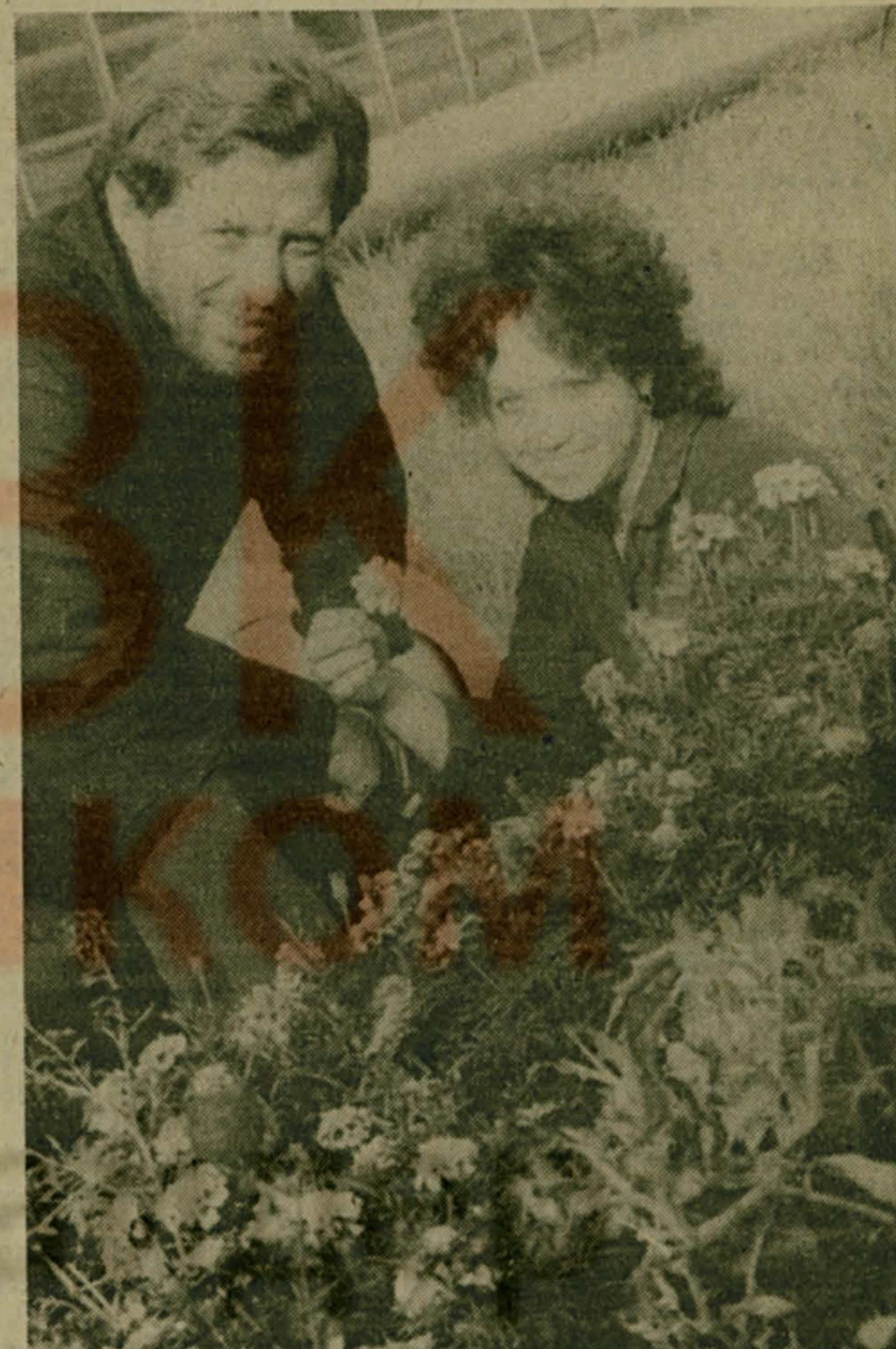
поздней осенью, радуют глаз пышные бархотки.

На территории совхоза «Белая Дача» и в его жилом микрорайоне каждую весну высаживается 40 тысяч цветочной рассады. И сейчас,