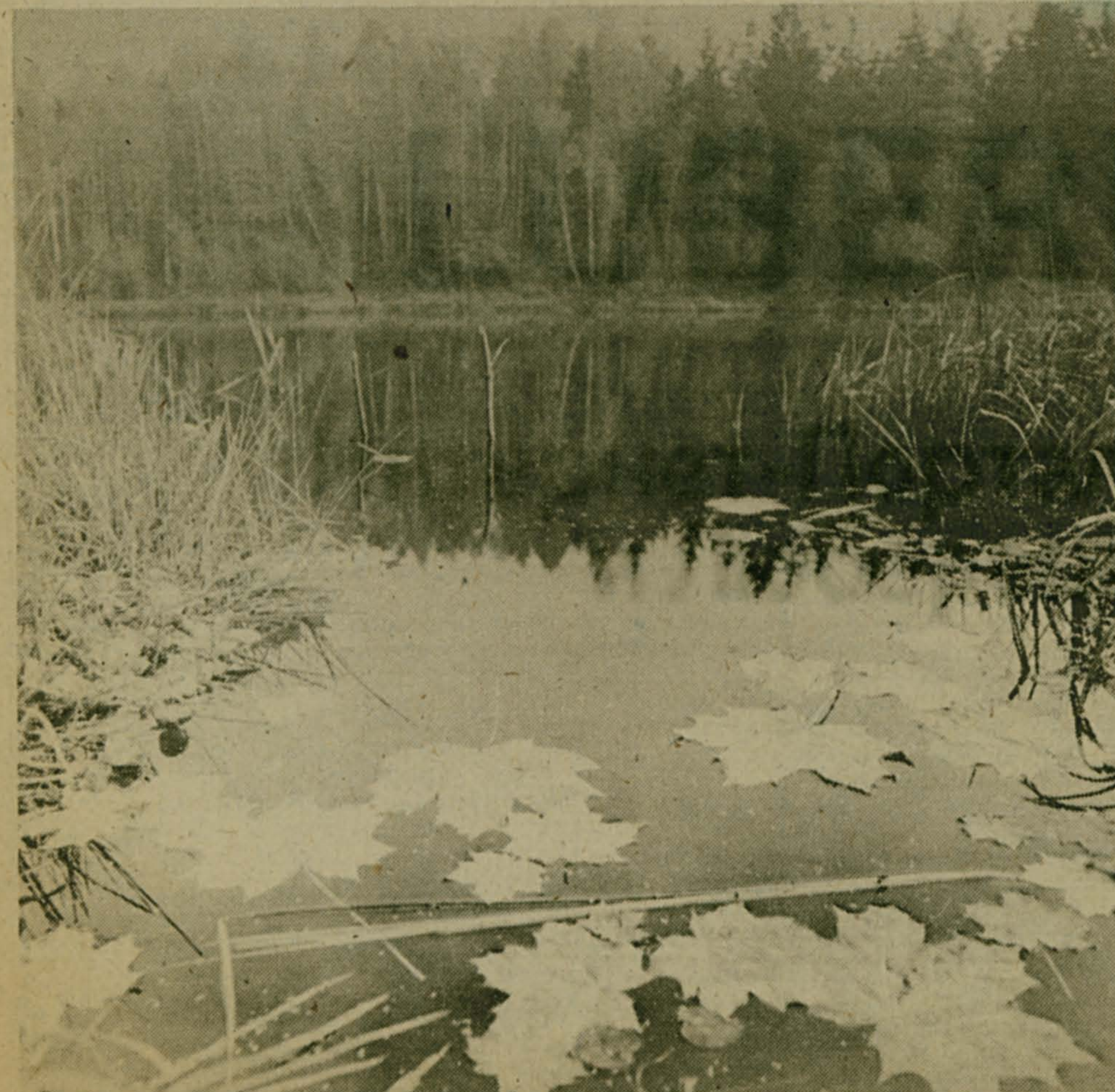
«Очей очарованье...»

Этим летом я купался в Святом озере. Вода теплая, но прозрачной ее не назывешь. Народу было порядочно. Только что-то я не заметил, чтобы бросали в волны кольца, полтинники или хотя бы пятаки. А. БЕЛОВ, краевед.