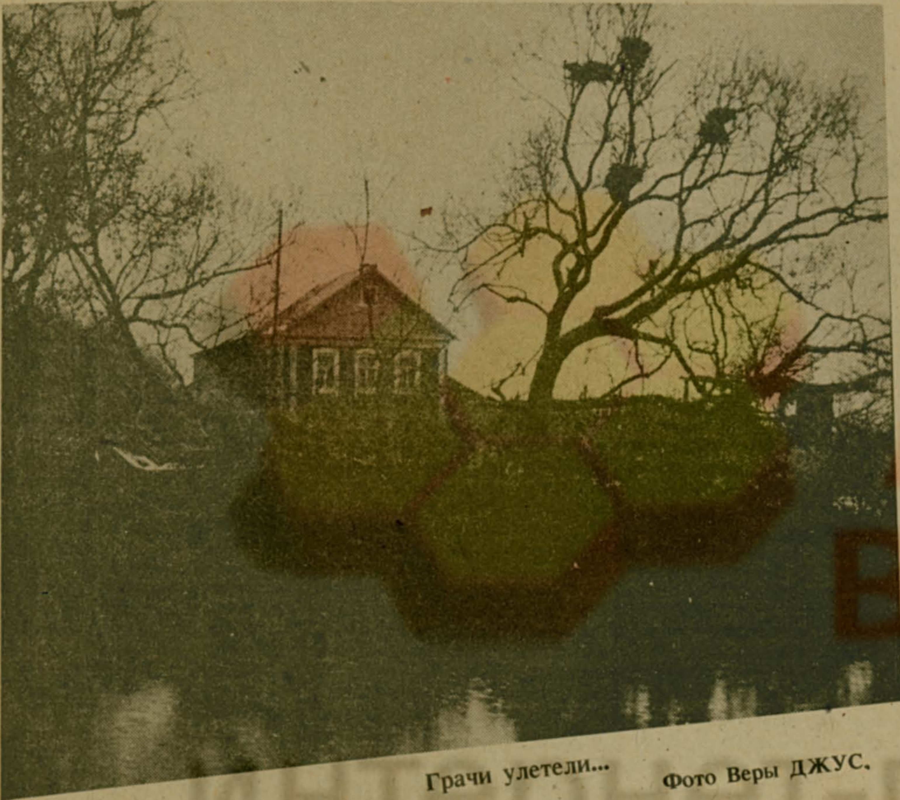
Грачи улетели...