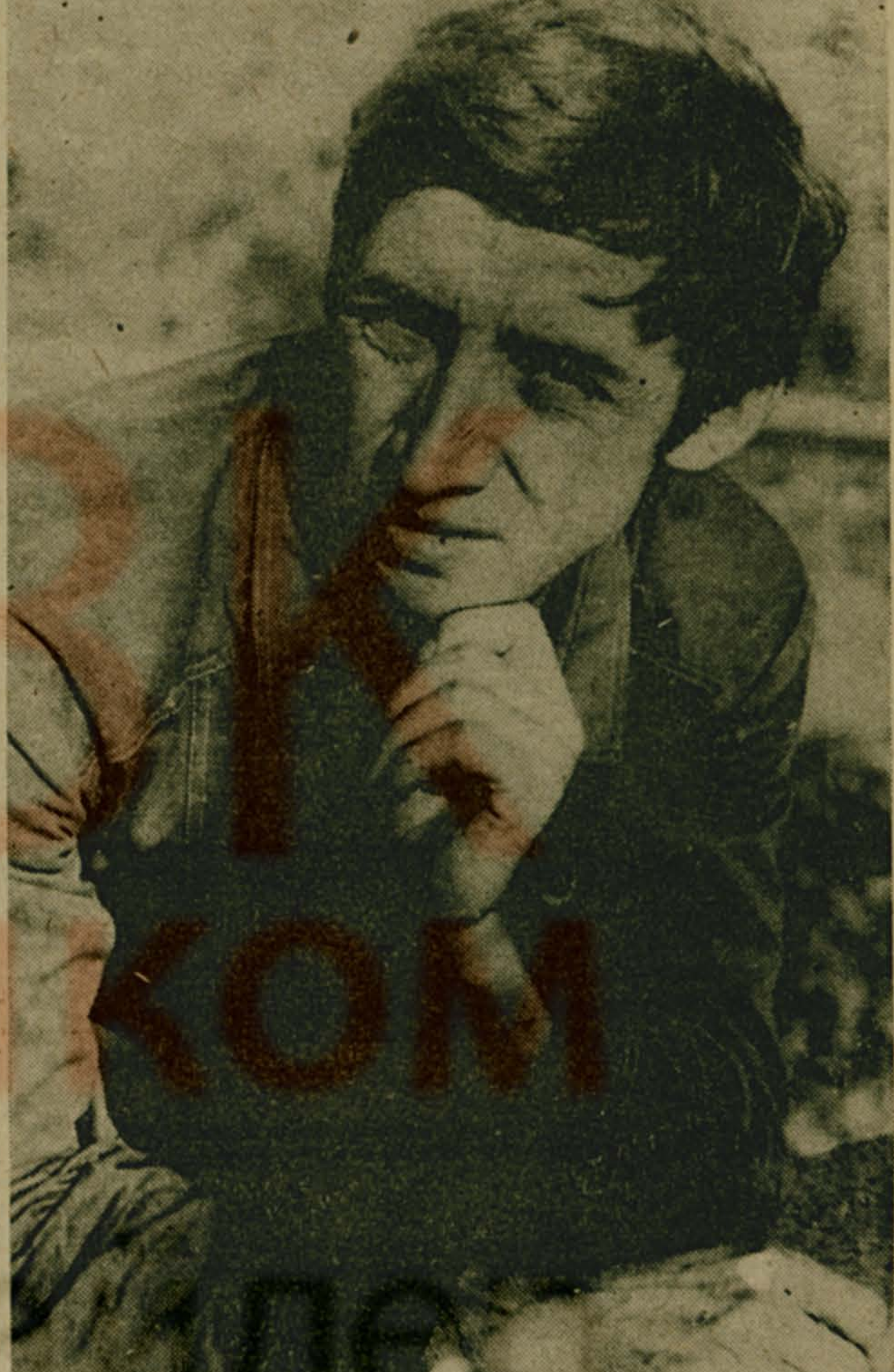
В рабочем строю

ки. И все же коллектив устремлен вперед. Разрабатываются новые виды изделий с аттестацией их на высшую категорию качества. Над проспектом проплывают транспаранты с Призывами ЦК КПСС. Ярко выделяются плакаты о реформе политической системы нашего общества, демократизации жизни. Проносится раскатистое «Ура!» над колоннами Ухтомского вертолетного завода, коврового комбината, заводов ВНИИБТ, электромусических инструментов, «Монтажавтоматика». С гордостью оглашают свои достижения строители, медицинские работники. Было что отобразить ученым институтам горного дела, обогащения твердых топлив, горнохимического сырья. Под знаменем всенародной перестройки проходила эта демонстрация в Люберцах. Ее участники, выразили стремление активно проводить обновление общества, успешно претворять в жизнь решения XXVII съезда партии и XIX Всесоюзной партконференции. Праздничные демонстрации состоялись также в городах Лыткарино и Дзержинский, в поселке Томилино. А в поселках Октябрьский, Котельники, Малаховка и Красково прошли массовые митинги трудящихся. П. БИЦУКОВ.