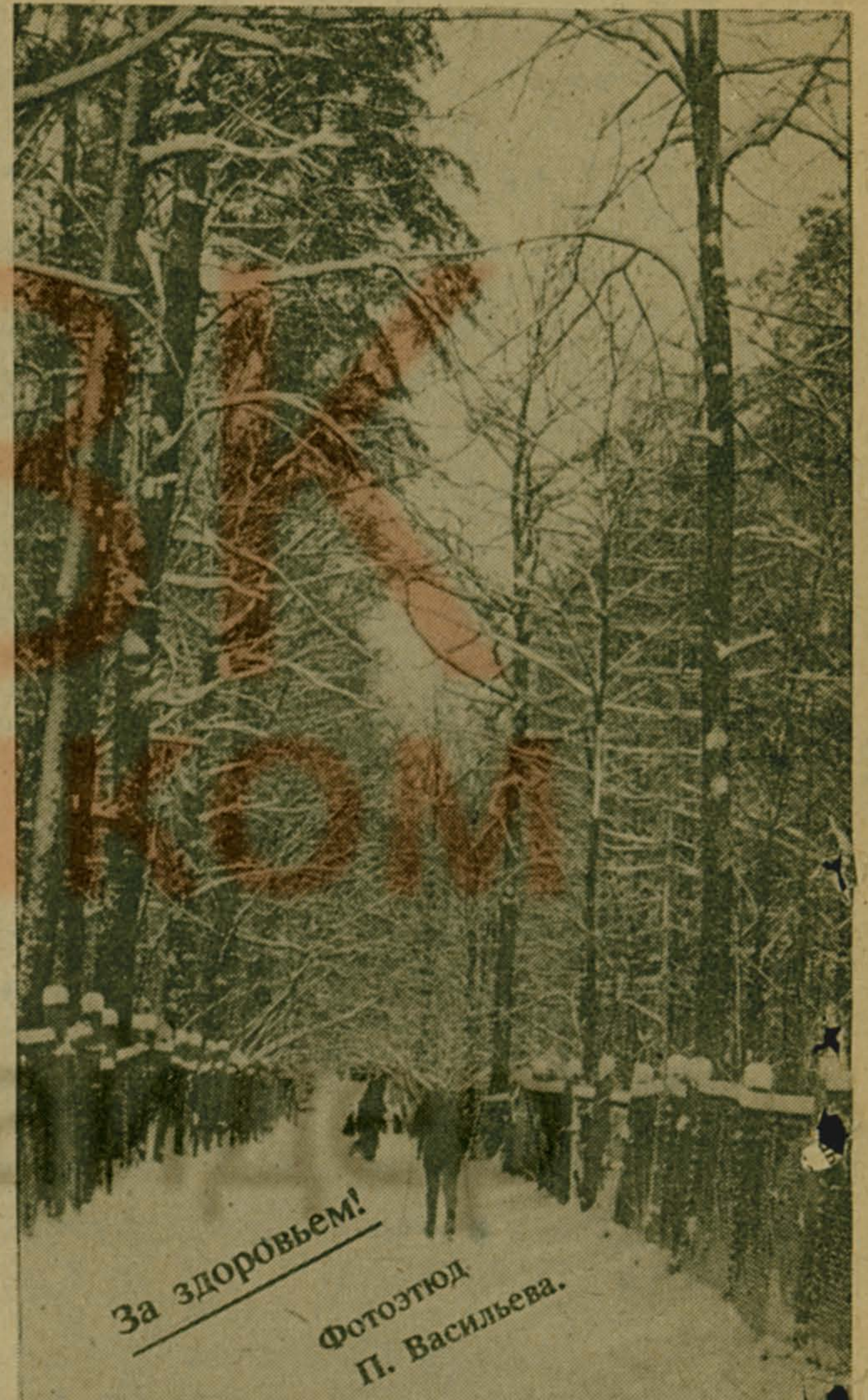
За здоровьем!