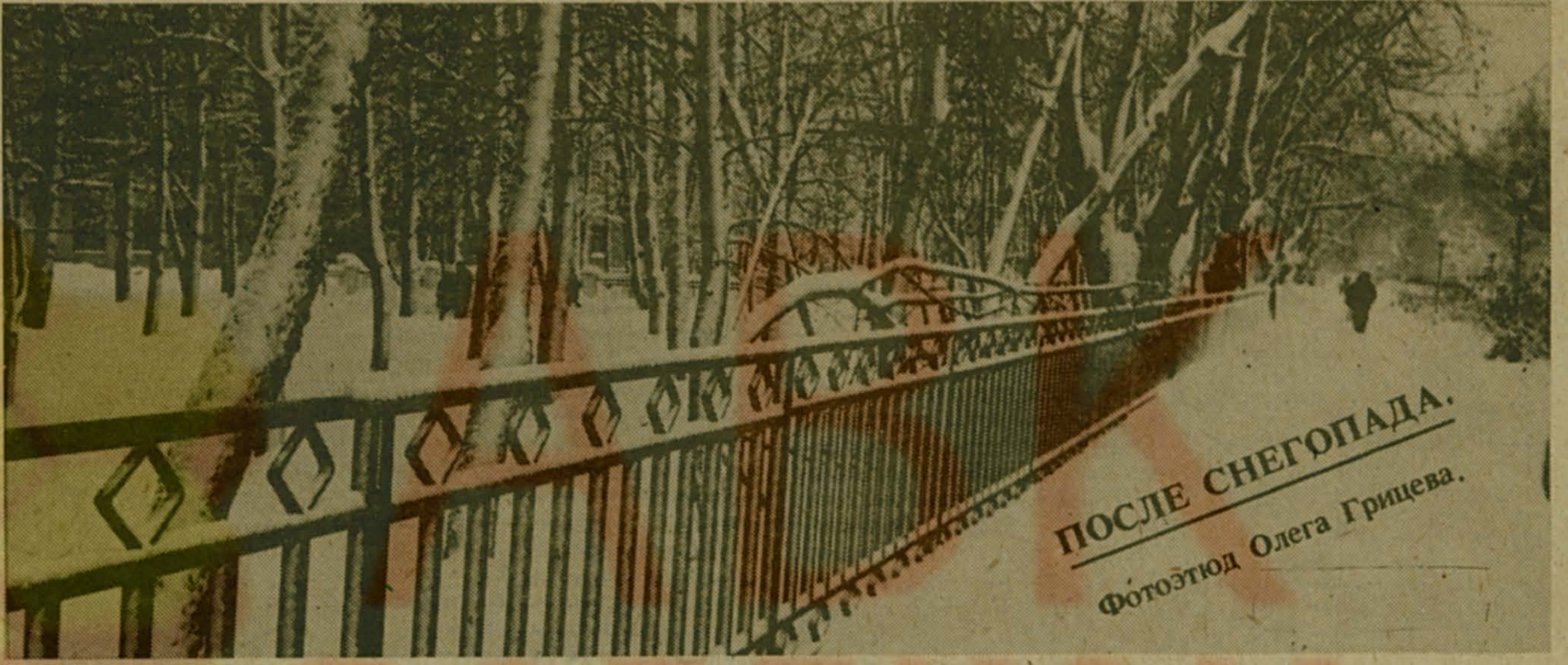
ПОСЛЕ СНЕГОПАДА.