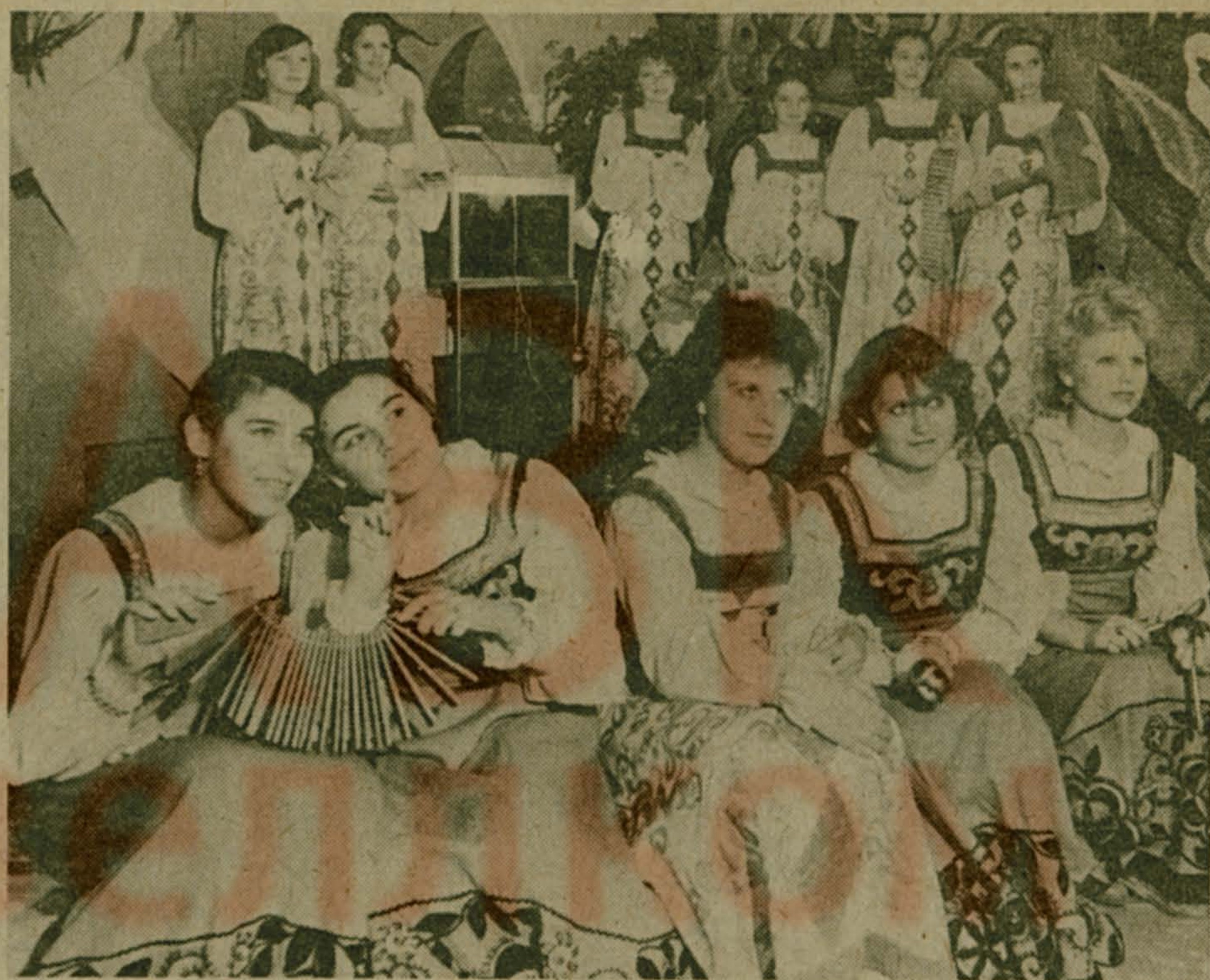
На репетиции.

Подобрав ключи, преступники проникли в квартиру на Юбилейной улице в Люберецах и унесли магнитофон