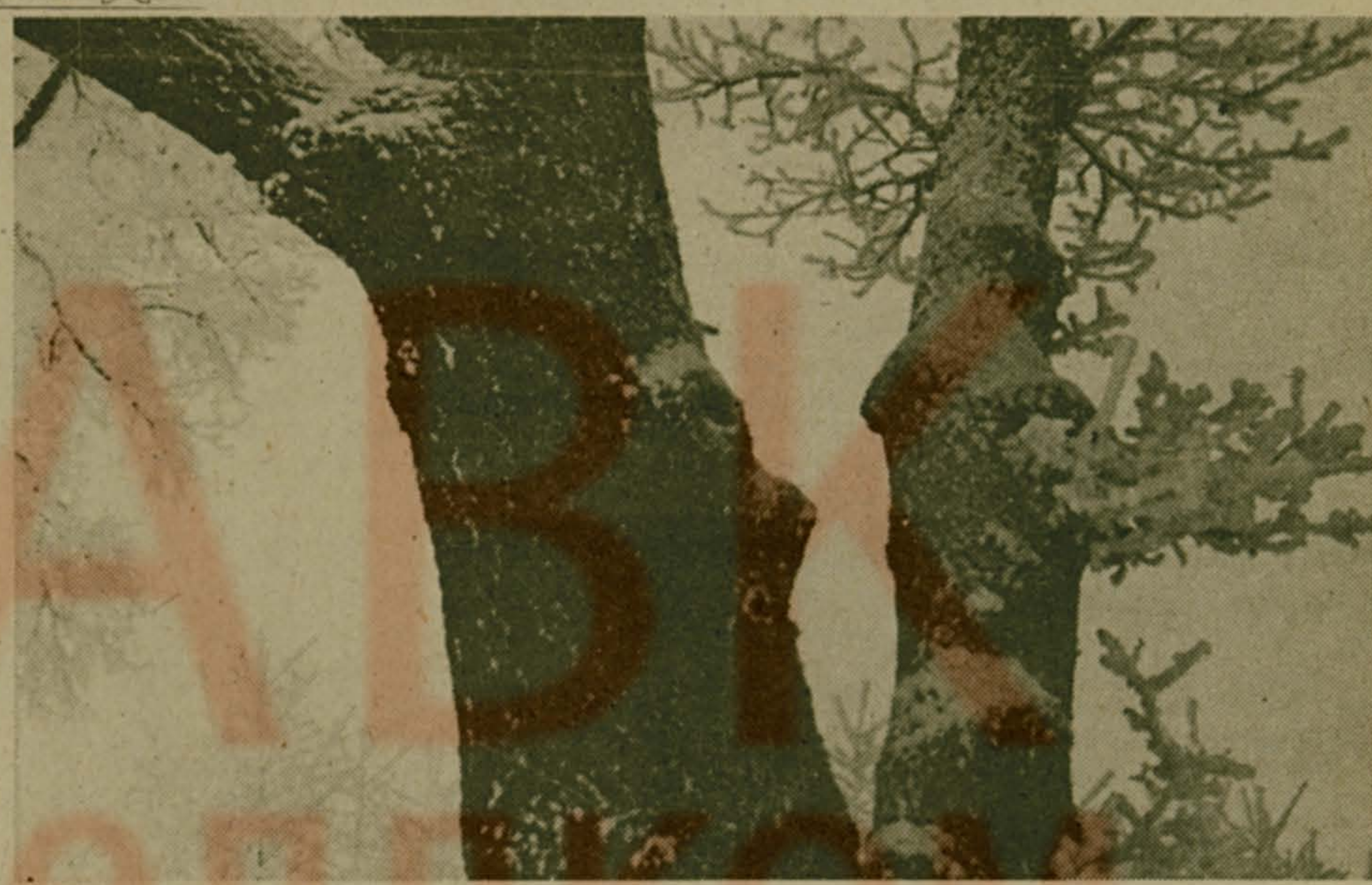
Фотоотряд А. Нахова

ПО ВЕРТИКАЛИ: 1. Коврига. 2. Страница. 3. Сингапур. 4. Шезлонг. 7. Осеева. 9. Лоцман. 10. Универсиада. 12. Артикуляция. 14. Мاستика. 16. Реформа. 17. Ребус. 18. Анапа. 20. Глагол. 21. Пинцет. 23. Варламов. 24. Карамель. 26. Носорог. 27. Равнина.