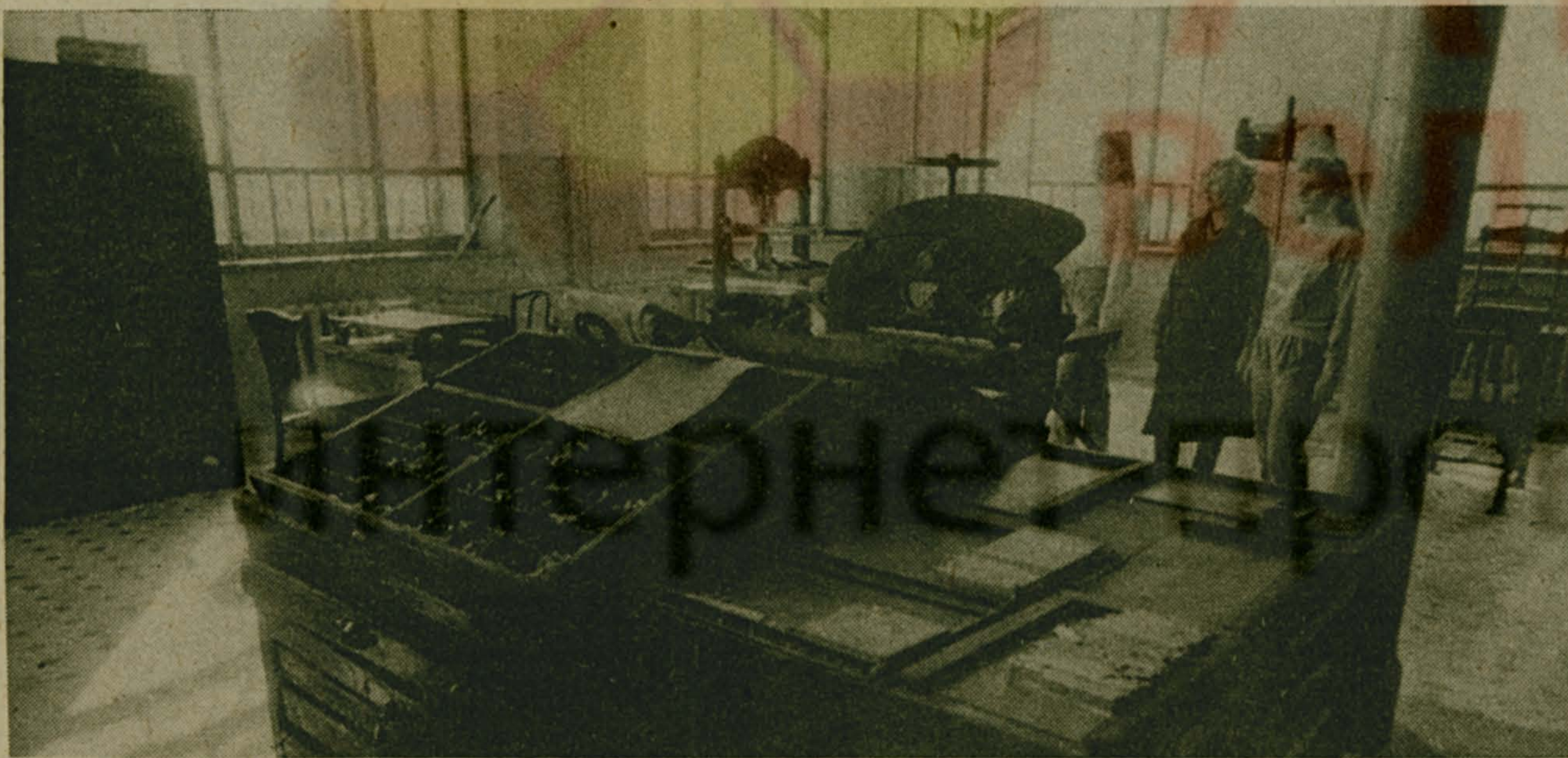
5 мая — День печати