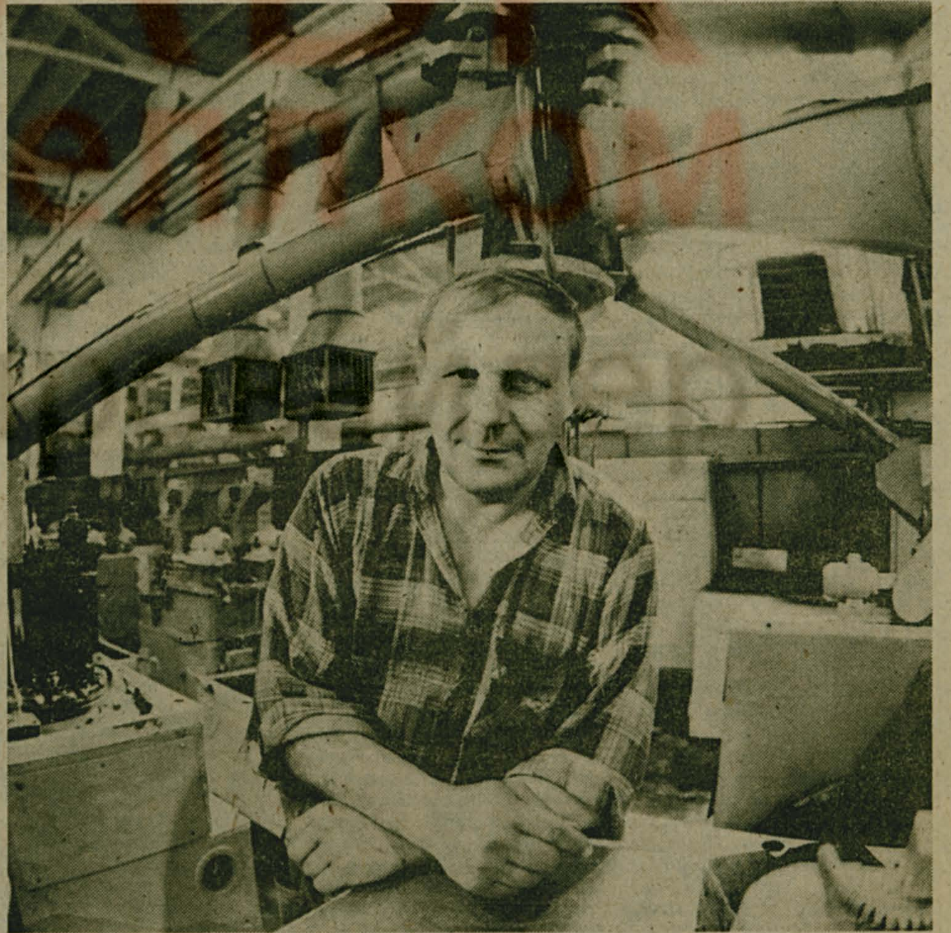
В постоянных комиссиях Люберецкого горсовета