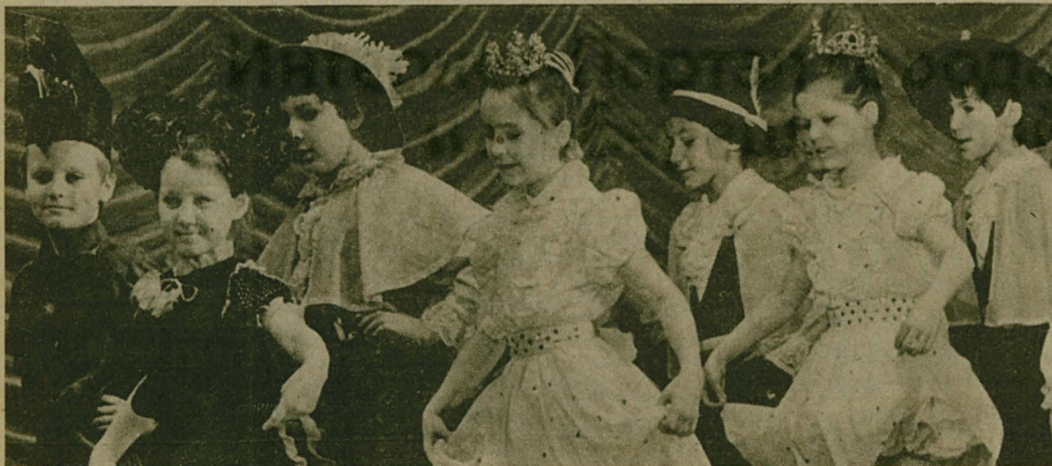
Выступает популярный детский ансамбль «Карусель» из Люберецкого Дворца культуры.