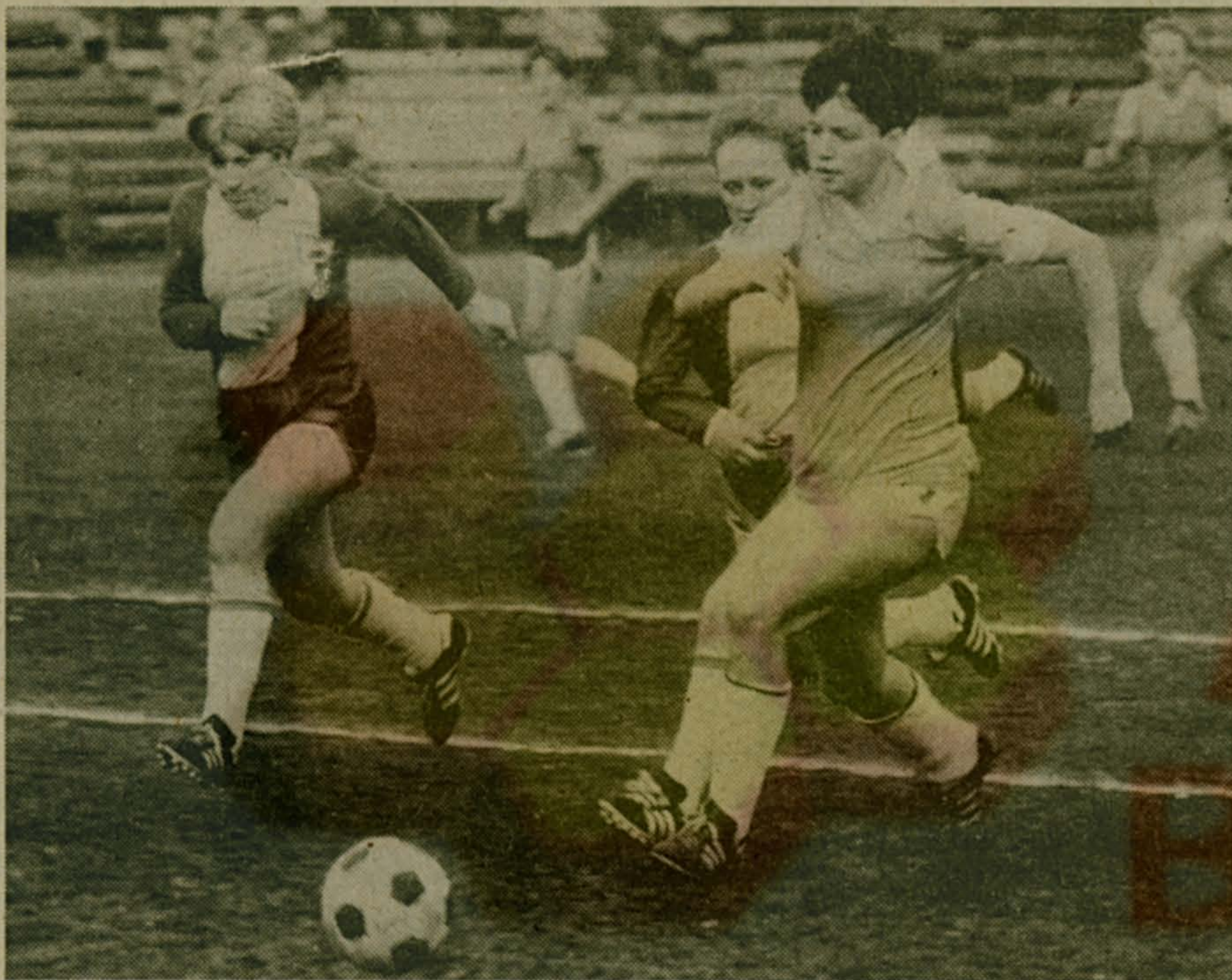
ОСТРАЯ АТАКА.