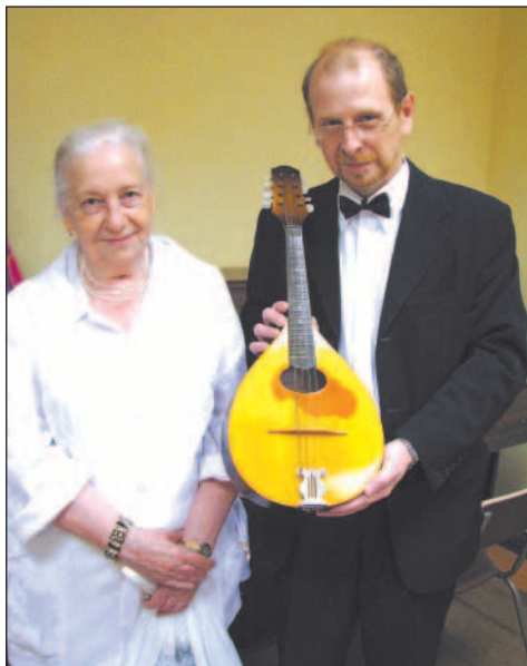
дачу «Пока все дома», и вы поймете, умирает русская балалайка или нет. И этим все сказано. Пожалуйста, звоните: 8-903-774-87-54, 8-919-961-92-27.