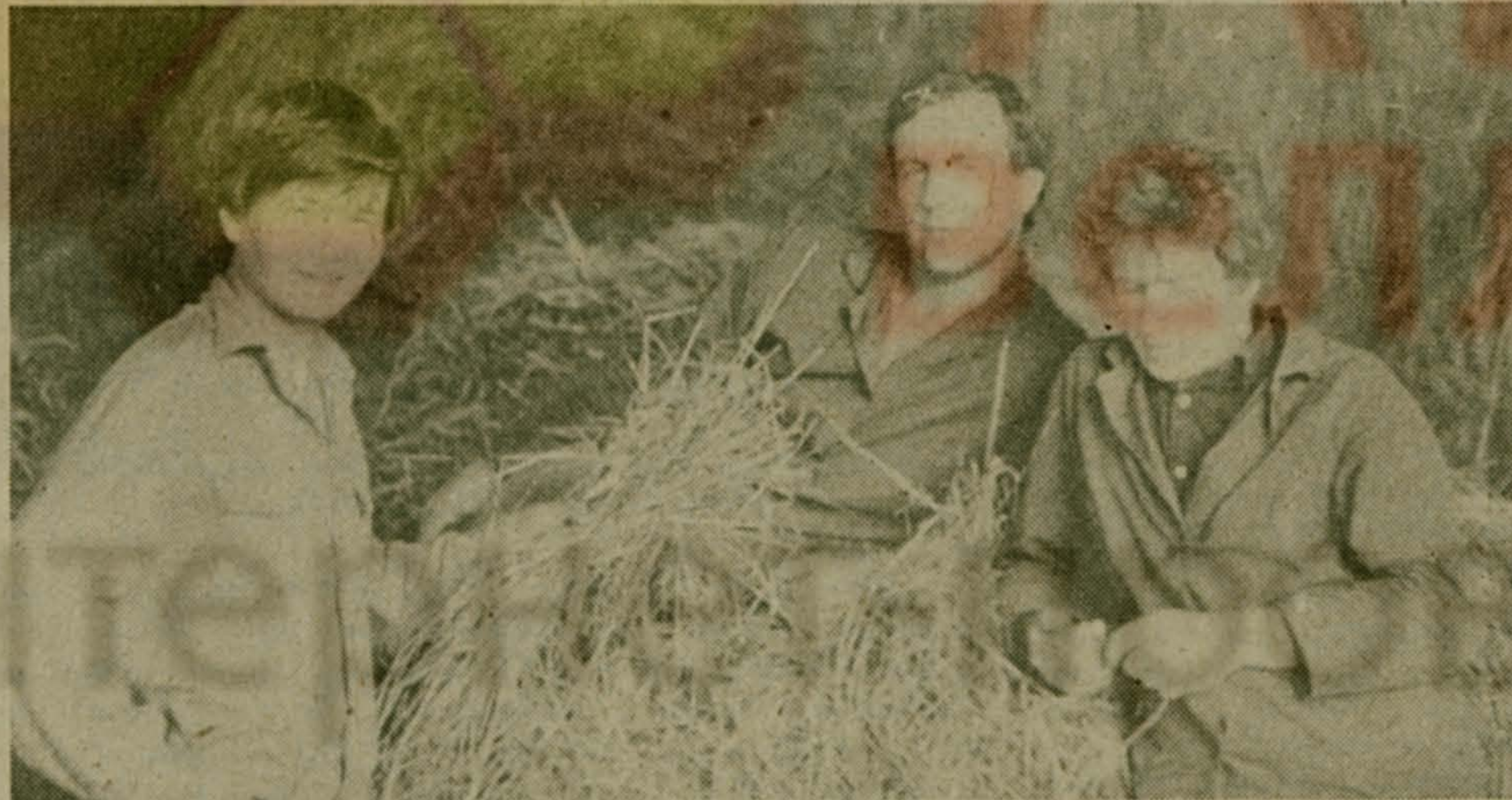
Люберецкие тысячи — в подмосковные миллионы