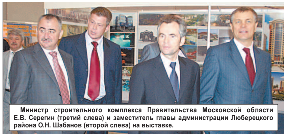
Министр строительного комплекса Правительства Московской области Е.В. Серегин (третий слева) и заместитель главы администрации Люберецкого района О.Н. Шабанов (второй слева) на выставке.

ГУБЕРНАТОР Б.В. ГРОМОВ НА ВЫСТАВКЕ «КРОКУС-ЭКСПО» ОТМЕТИЛ ЭКСПОЗИЦИЮ ЛЮБЕРЕЦКОГО РАЙОНА