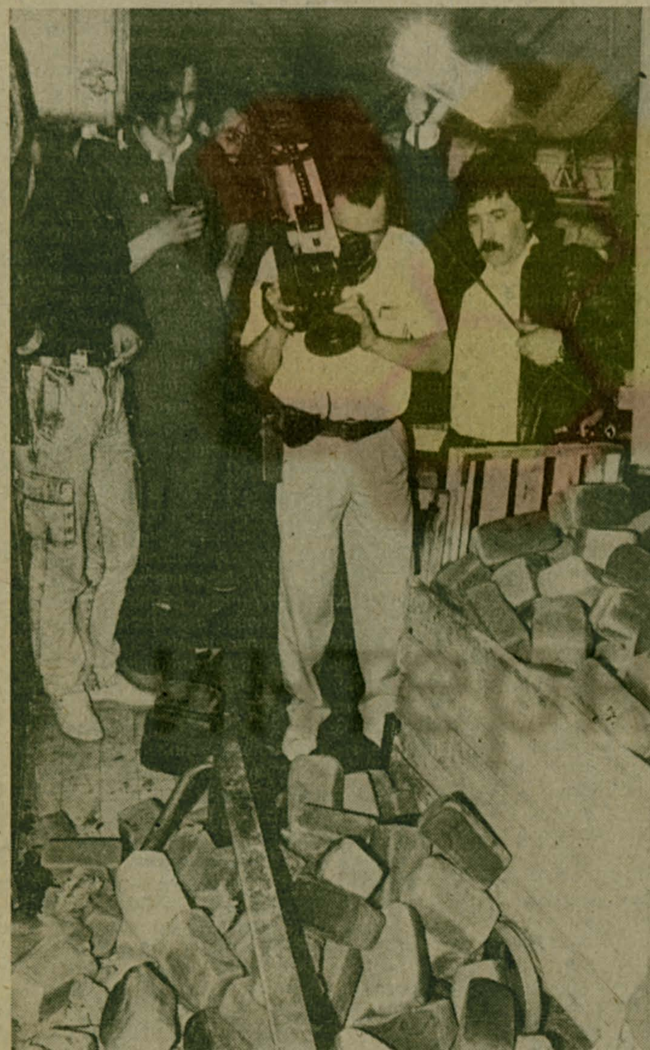
Репортер ставит проблему «600 секунд» И весь день

На снимках: комментатор Александр Невзоров — в гуще событий города; творческая группа программы готовит материал с хлебозавода Московского района Ленинграда. Вот такое отношение здесь к хлебу; в эфире — программа «600 секунд».