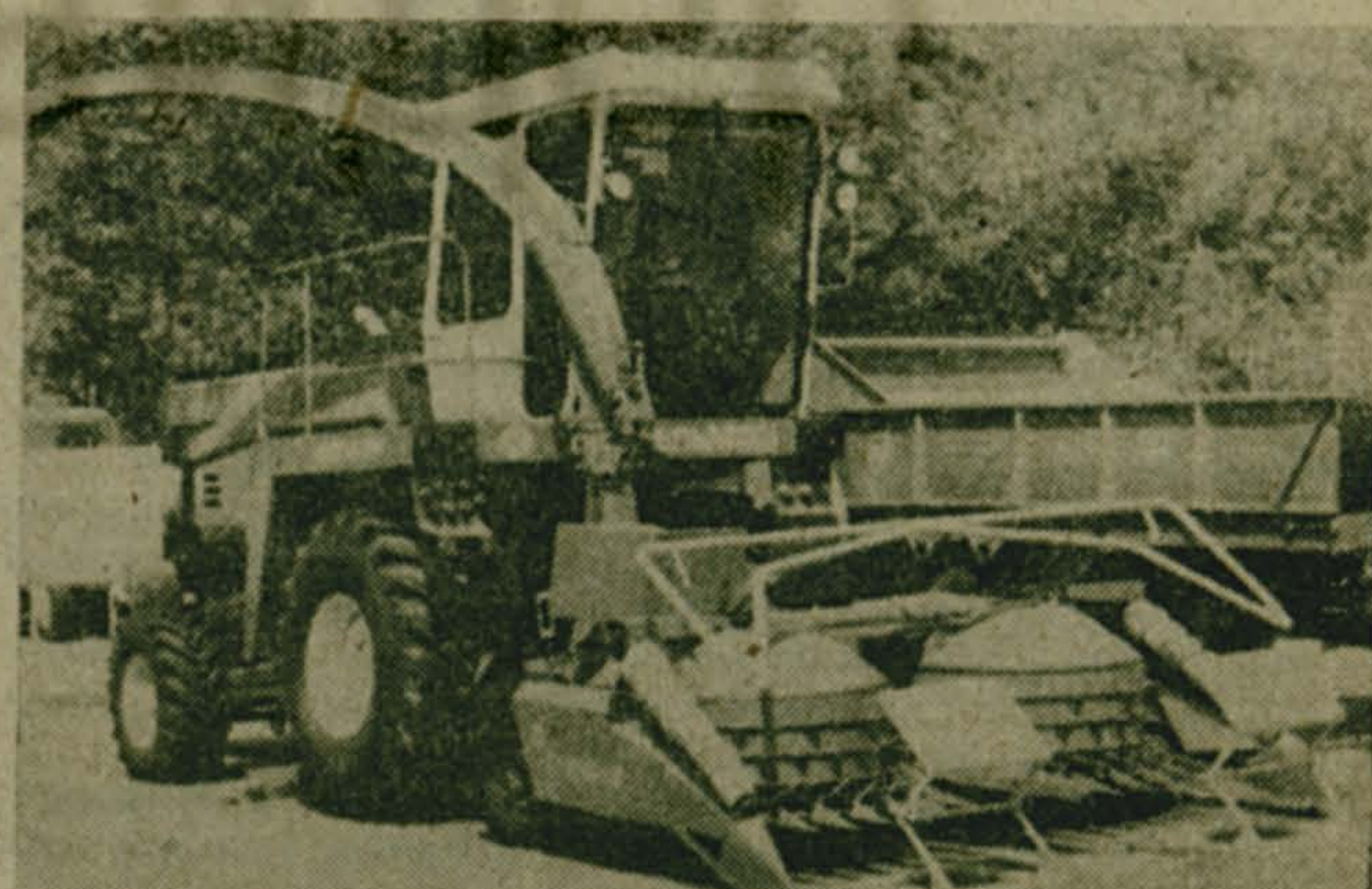
Фото и текст Д. Башкова.

На снимках: КСКУ-6А и КСК-Ф-250 «Полесье».