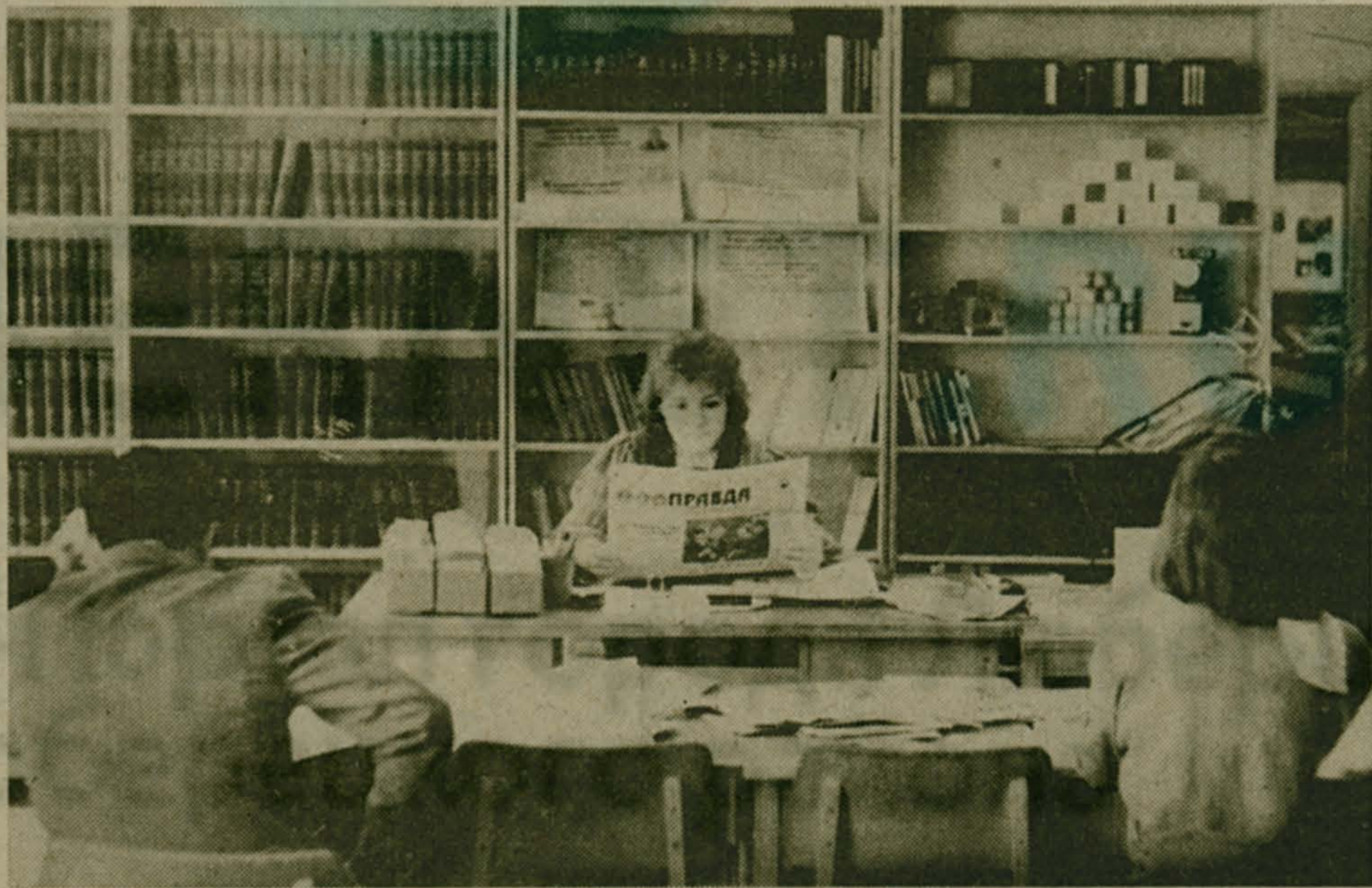
Библиотека Люберецкго городского комитета партии пользуется и посетителей широкой популярностью. Здесь собрана вся литература — книги, журналы, брошюры, проспекты, газеты, словом, то, что необходимо работникам

необходимым (и это отражено в его постановлении) незамедлительно, не позднее 1 января 1990 года, поднять минимальный размер пенсий по старости всем гражданам до уровня минимальной заработной платы, ликвидировав при этом различия в пенсионном обеспечении колхозников, рабочих и служащих, а также повысить минимальный размер пенсий инвалидам I и II групп, вдовам и родителям погибших военнослужащих. Кроме того, льгота по выплате полностью пенсии по старости рабочим и мастерам без учета заработной платы, предоставляемая сейчас в Москве, распространится на всю территорию СССР. Независимо от получаемого заработка будет полностью выплачиваться пенсия всем работающим инвалидам II и III групп.