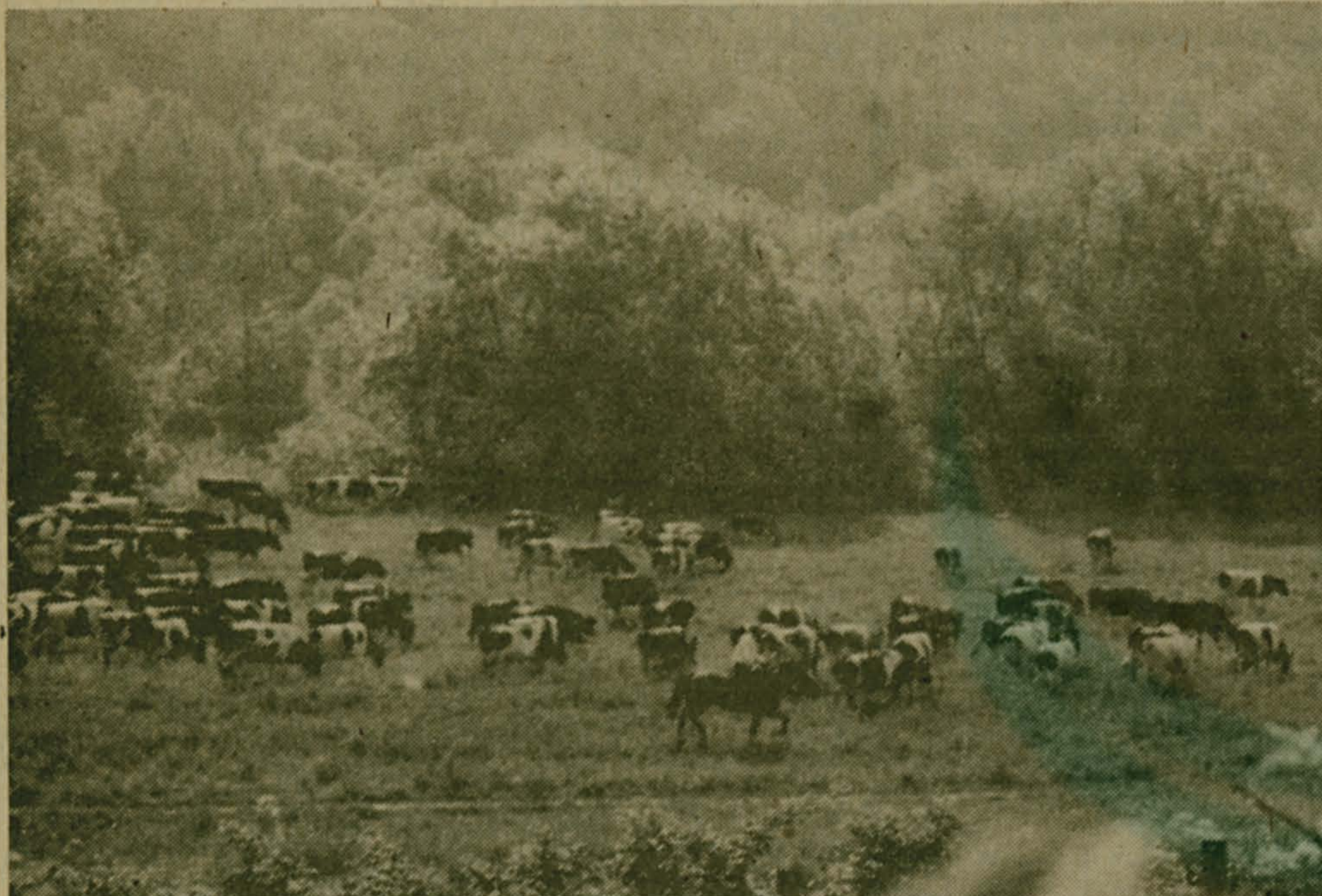
Август. Утро. В дымке звонкой Поле, лес и луг.