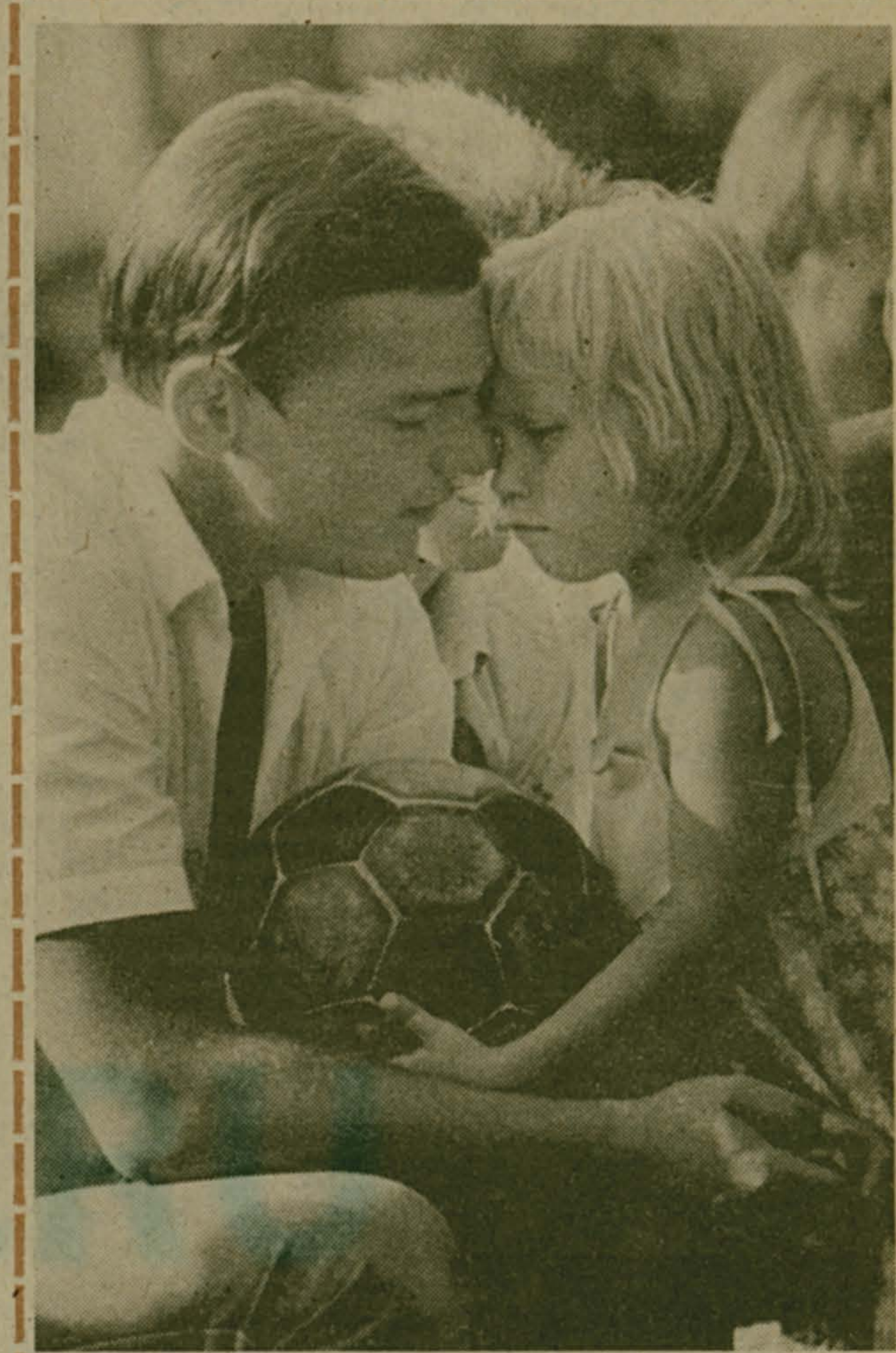
Мы еще сыграем, дочка!