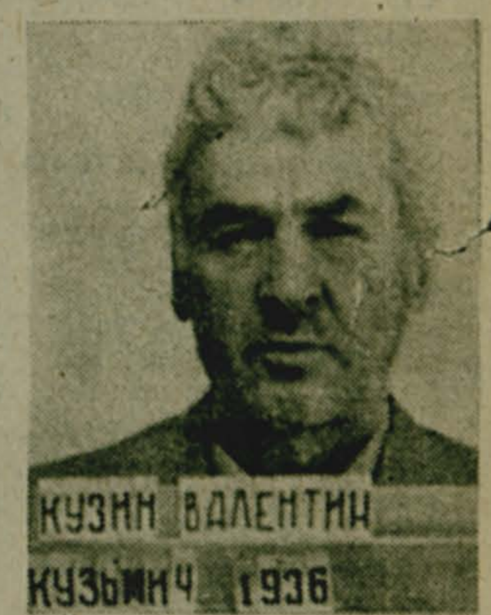
КУЗМИН ВАЛЕНТИН КУЗЬМИН 1936

Диапазон вредного действия алкоголя поистине необъятен. Спиртное туманит соображение, не считается с