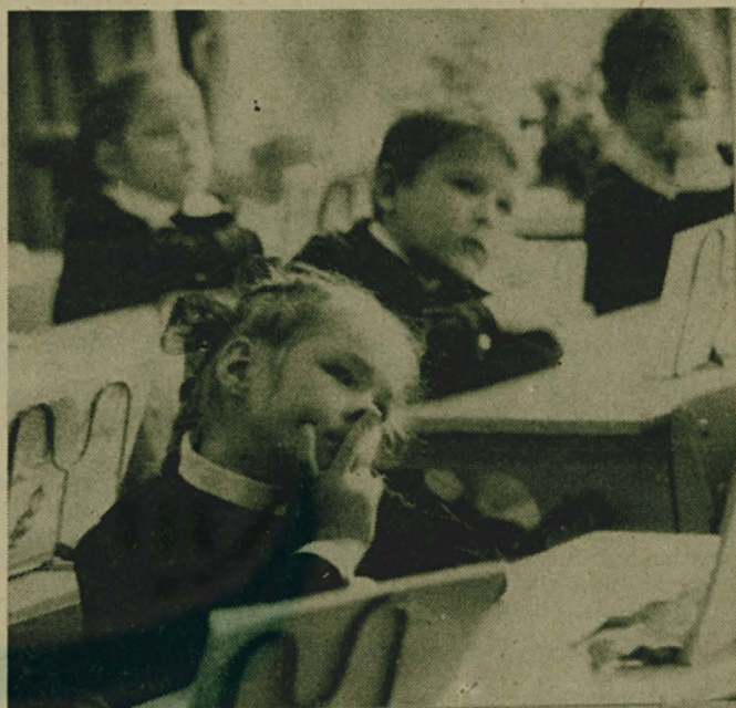
ОЧЕНЬ ДАЖЕ ИНТЕРЕСНО! Фото Л. НАДЕИНОЙ.