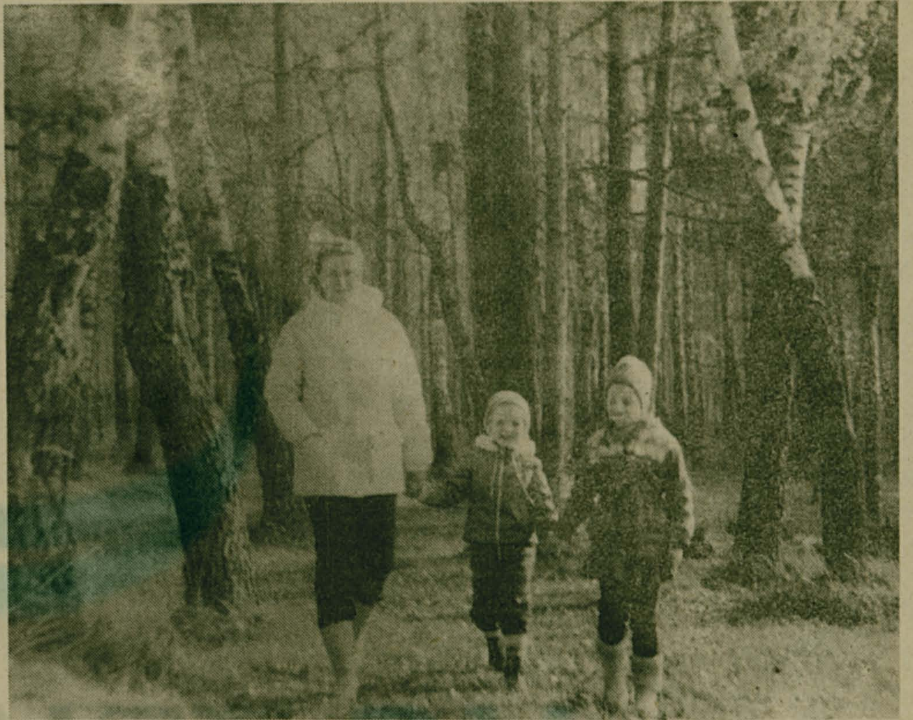
С МАМОЙ В ЛЕС

А жизнь тем временем вносит новые загадки. 31 августа на берегу Москвы-