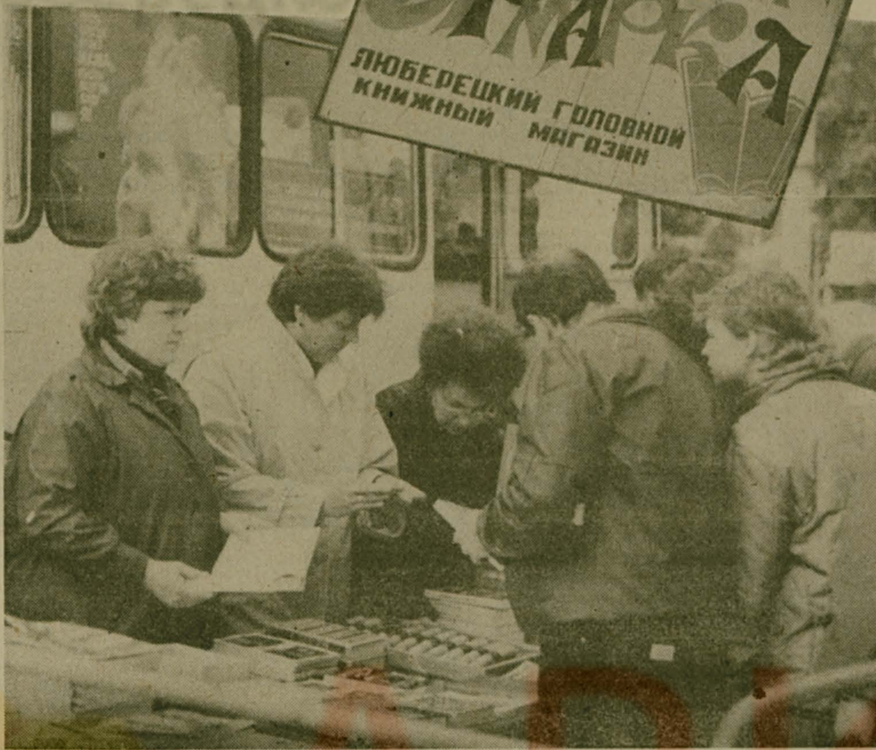
Репортаж с Международной книжной ярмарки