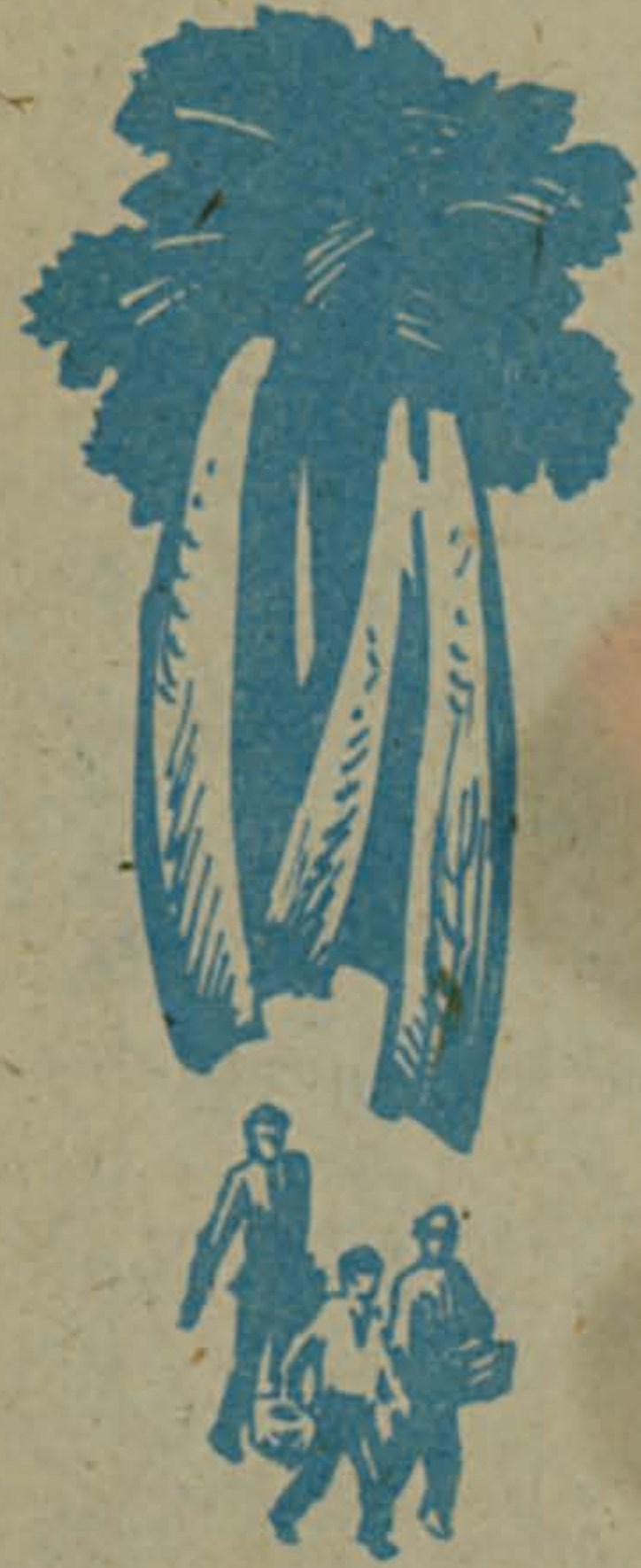
Рисунок Виктора КУНТАШЕВА.