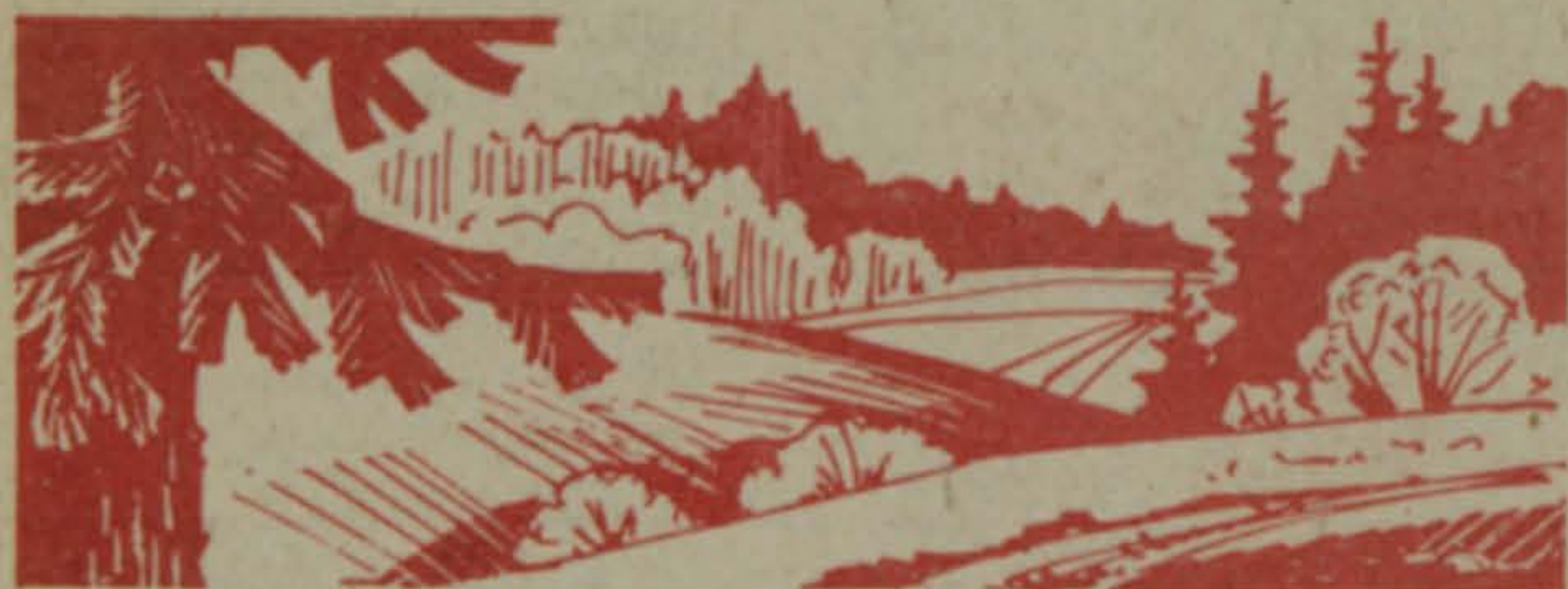
Рисунок Виктора КУНТАШЕВА.