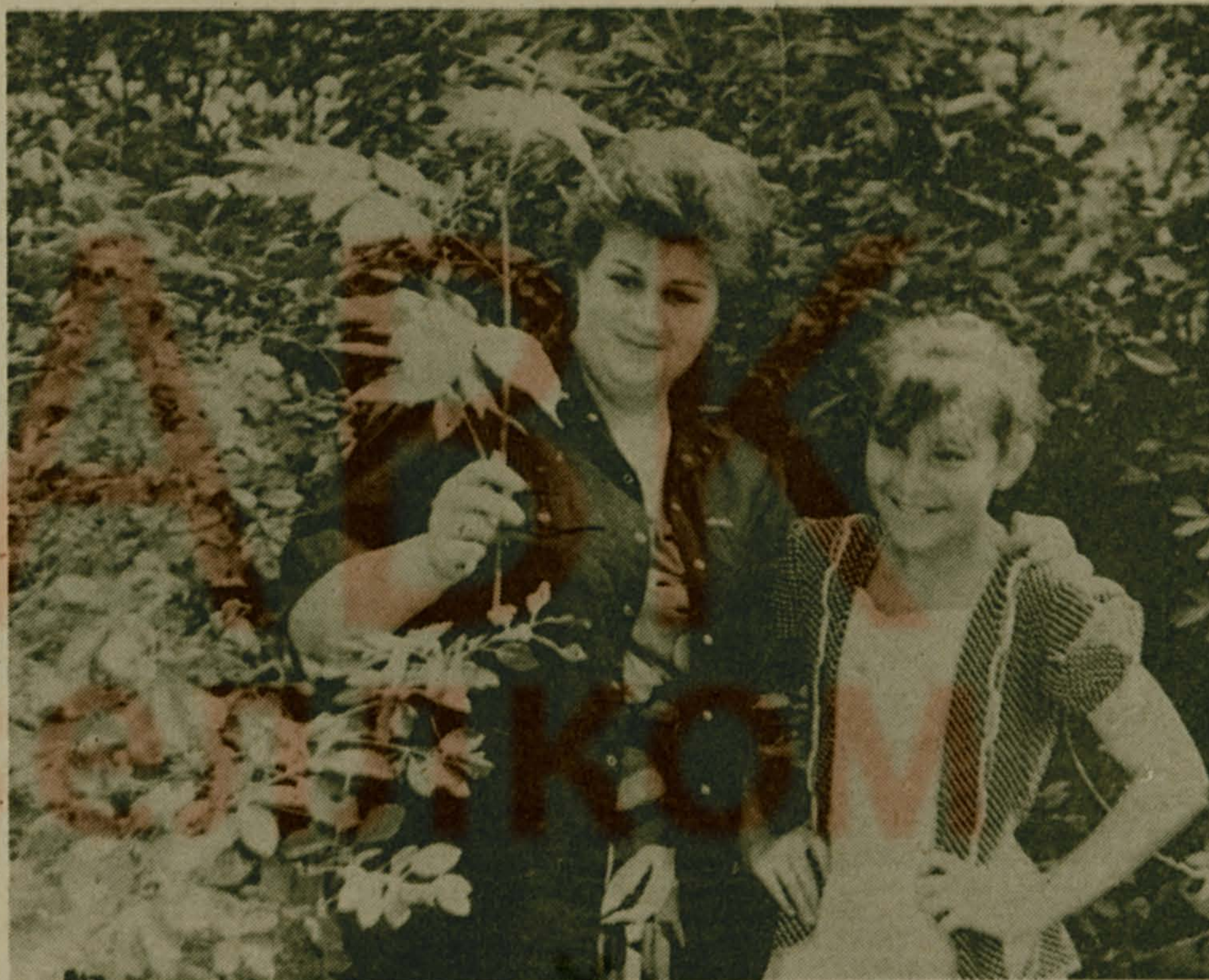
Была недавно осень золотая...